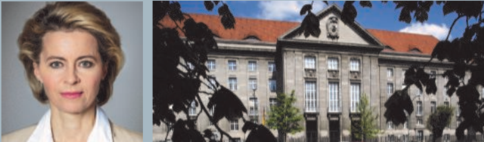
Im Herzen der „Berliner Republik“: die Schirmherrin der Konferenz, Bundesministerin Dr. Ursula von der Leyen, und der Berliner Dienstsitz des Verteidigungsministeriums

Unter der Schirmherrschaft der Bundesministerin der Verteidigung, Dr. Ursula von der Leyen, laden das Bundesministerium der Verteidigung und die Bundesakademie für Sicherheitspolitik Studentinnen und Studenten aller Fachrichtungen nach Berlin ein, um sich mit Sicherheitspolitik zu befassen – und zwar ganz praktisch. Das Thema in diesem Jahr: Sicherheit auf dem afrikanischen Kontinent.