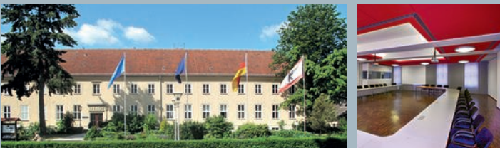
Die Bundesakademie für Sicherheitspolitik bietet als moderne Tagungs- und Konferenzeinrichtung ideale Bedingungen zur Weiterbildung und Vernetzung.

Die Konferenz bietet darüber hinaus die Chance, sich mit Experten und Praktikern verschiedener Bundesministerien und Behörden auszutauschen, um aus erster Hand Einblicke in Strukturen und Prozesse der deutschen und der internationalen Sicherheitspolitik zu erhalten.