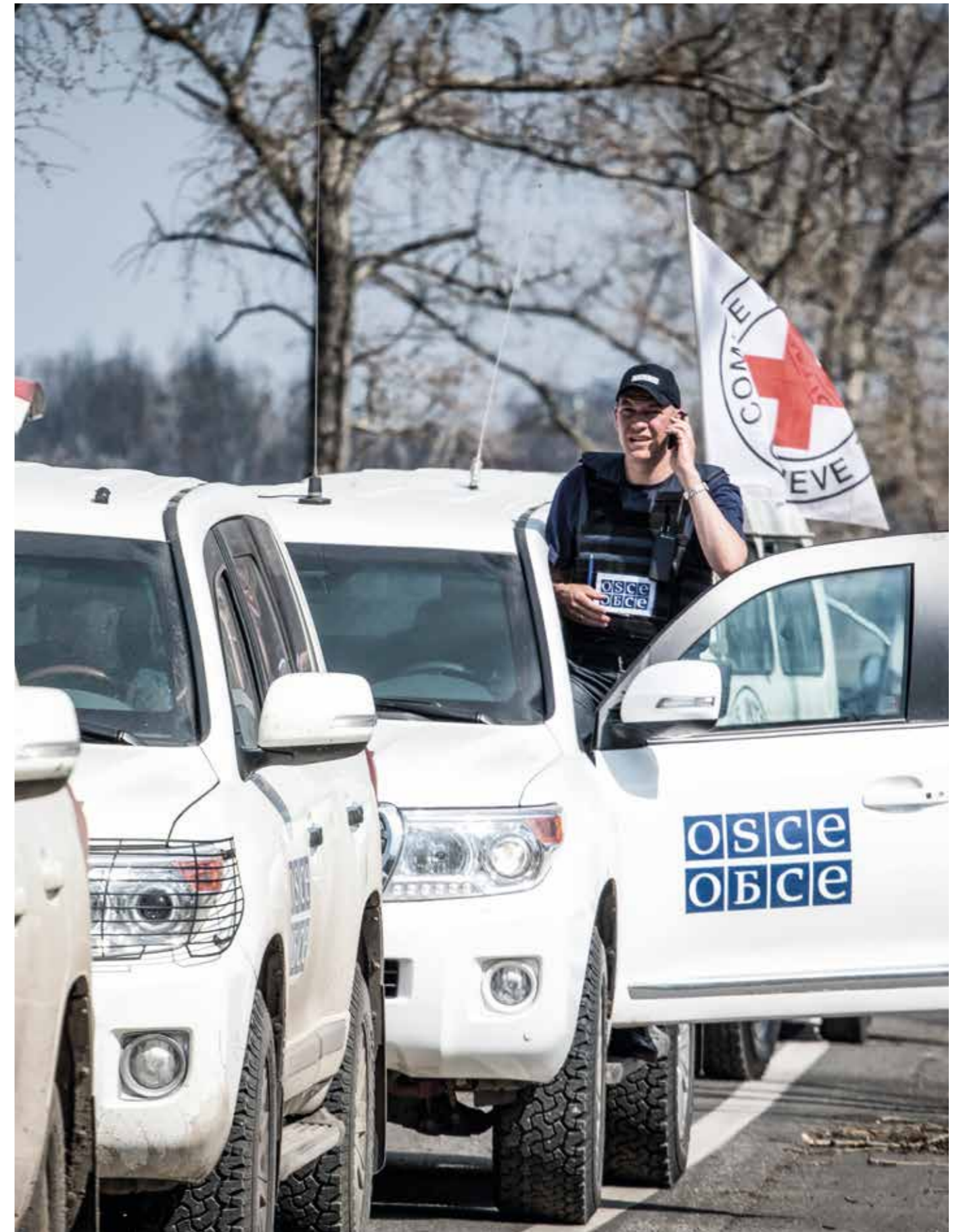
Auf Transparenz und Vertrauen setzen – das deutsche Engagement zur Stärkung der OSZE bleibt ungebrochen.