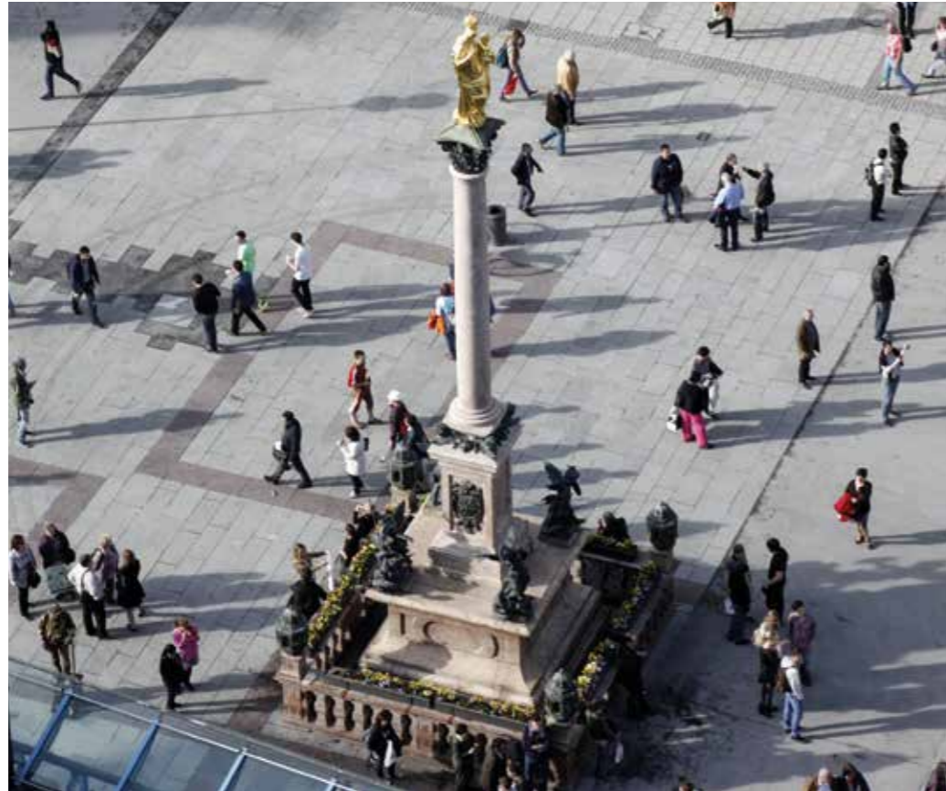
Ein Leben in Freiheit, Wohlstand und Sicherheit – Ziel und Anspruch deutscher Sicherheitspolitik.