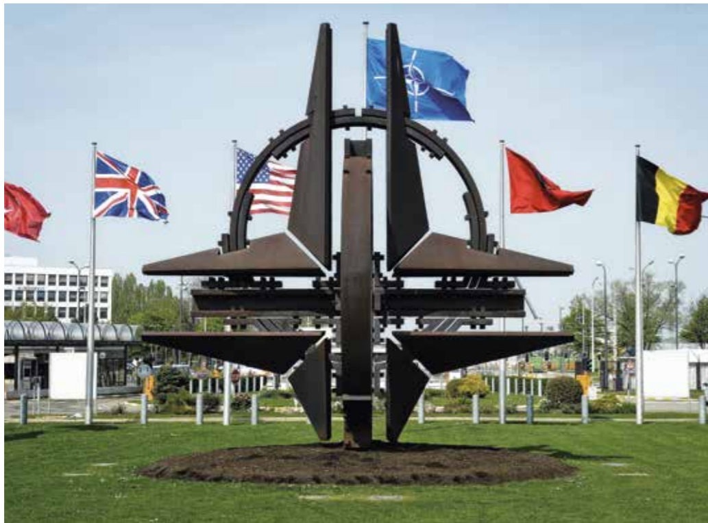
NATO – unverzichtbarer Garant deutscher, europäischer und transatlantischer Sicherheit.

Wirksame kollektive Verteidigung ist angesichts der Rückkehr von Gewalt und Gewaltandrohung in die europäische Politik sowie der Instabilitäten in der Nachbarschaft des Bündnisgebietes von existenzieller Bedeutung. Dies gilt erst recht unter den Bedingungen weltweiter Proliferation von Massenvernichtungswaffen und Trägermitteln sowie der umfassenden Aufrüstung in zahlreichen Staaten. Gegenüber äußeren