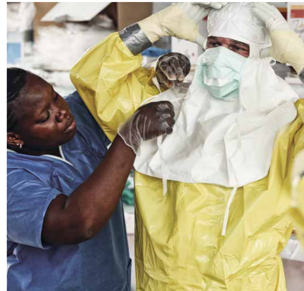
Pandemien und Seuchen – weit entfernt geglaubt, durch Globalisierung doch ganz nah.

Deutschland unterstützt die Prävention und Bewältigung derartiger Herausforderungen insbesondere auch mit der Optimierung der Koordinierungs- und Krisenmanagementfähigkeiten der multilateralen Organisationen, wie der WHO. Wichtige Beiträge hierzu sind etwa die Unterstützung der bestehenden europäischen Instrumente im Rahmen des EU-Katastrophenschutzmechanismus (European Medical Corps) und der Aufbau eines Kontingents an Ärzten und medizinischem Fachpersonal auf nationaler und europäischer Ebene sowie logistischer Fähigkeiten zu deren schneller Verlegung in Krisengebiete.