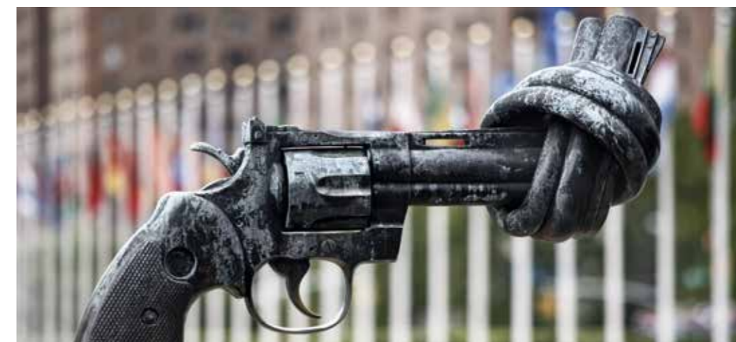
VN – in Verantwortung für den Weltfrieden.