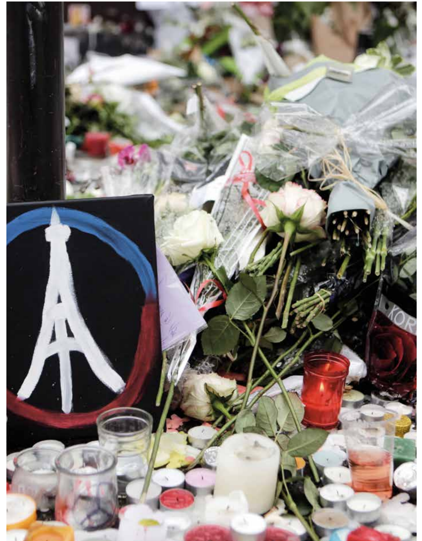
Vereint gegen Terror – transnationaler Terrorismus bedroht unsere freie und offene Gesellschaft unmittelbar.

Die effektive Bekämpfung des transnationalen Terrorismus erfordert daher enge nationale und internationale, europäische und transatlantische Zusammenarbeit. Hierzu bedarf es des Einsatzes politischer, rechtlicher, nachrichtendienstlicher, polizeilicher und militärischer Mittel. Neben der Gefahrenabwehr sind umfassende Maßnahmen notwendig, um bei der Auseinandersetzung mit den ideologischen, fanatisiert religiösen, gesellschaftlichen und sozioökonomischen Ursachen von Radikalisierung und Terrorismus erfolgreich zu sein. Radikalem Denken und Handeln muss auch in unserer eigenen Gesellschaft begegnet werden.