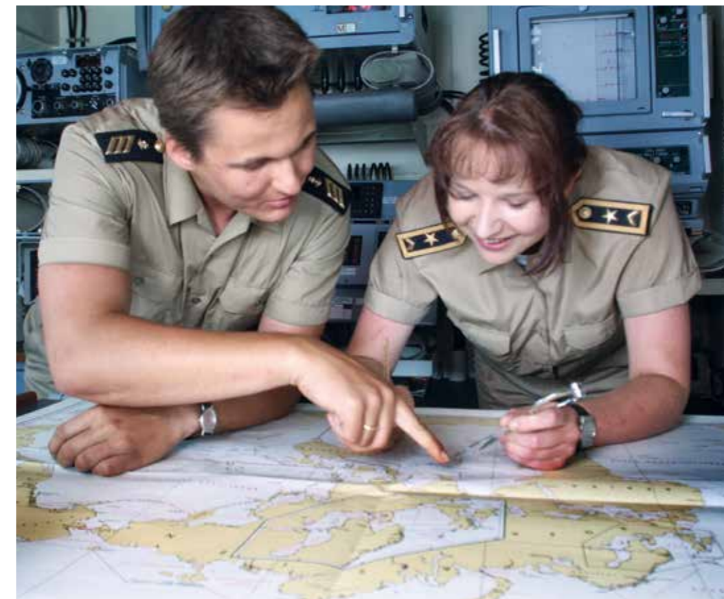
Innere Führung – im Dialog zur Entscheidung.

Aufgeschlossen, modern und vielfältig vernetzt wird die Bundeswehr auch in Zukunft bleiben, insbesondere weil sie selbstbewusst und in sich gefestigt ist. Grundlage dafür ist die Innere Führung. Sie ist und bleibt das unverzichtbare Fundament für individuelles und kollektives Handeln in den Streitkräften, da sie das Gewissen jeder und jedes Einzelnen als moralische Instanz anerkennt. Denn absehbar bleibt ein Spannungsfeld bestehen zwischen den persönlichen demokratischen Freiheitsrechten auf der einen Seite und den soldatischen Prinzipien von Pflicht und Gehorsam auf der anderen Seite. Die Innere Führung vermittelt den Soldatinnen und Soldaten dabei Handlungssicherheit und Urteilsvermögen. Sie gibt ihnen Mut und Zuversicht, selbstverantwortete und ethisch abgewogene Entscheidungen zu treffen. Diese Philosophie prägt ein Menschenbild, das als Orientierung für den Umgang miteinander dient und tagtäglich vorgelebt werden muss.