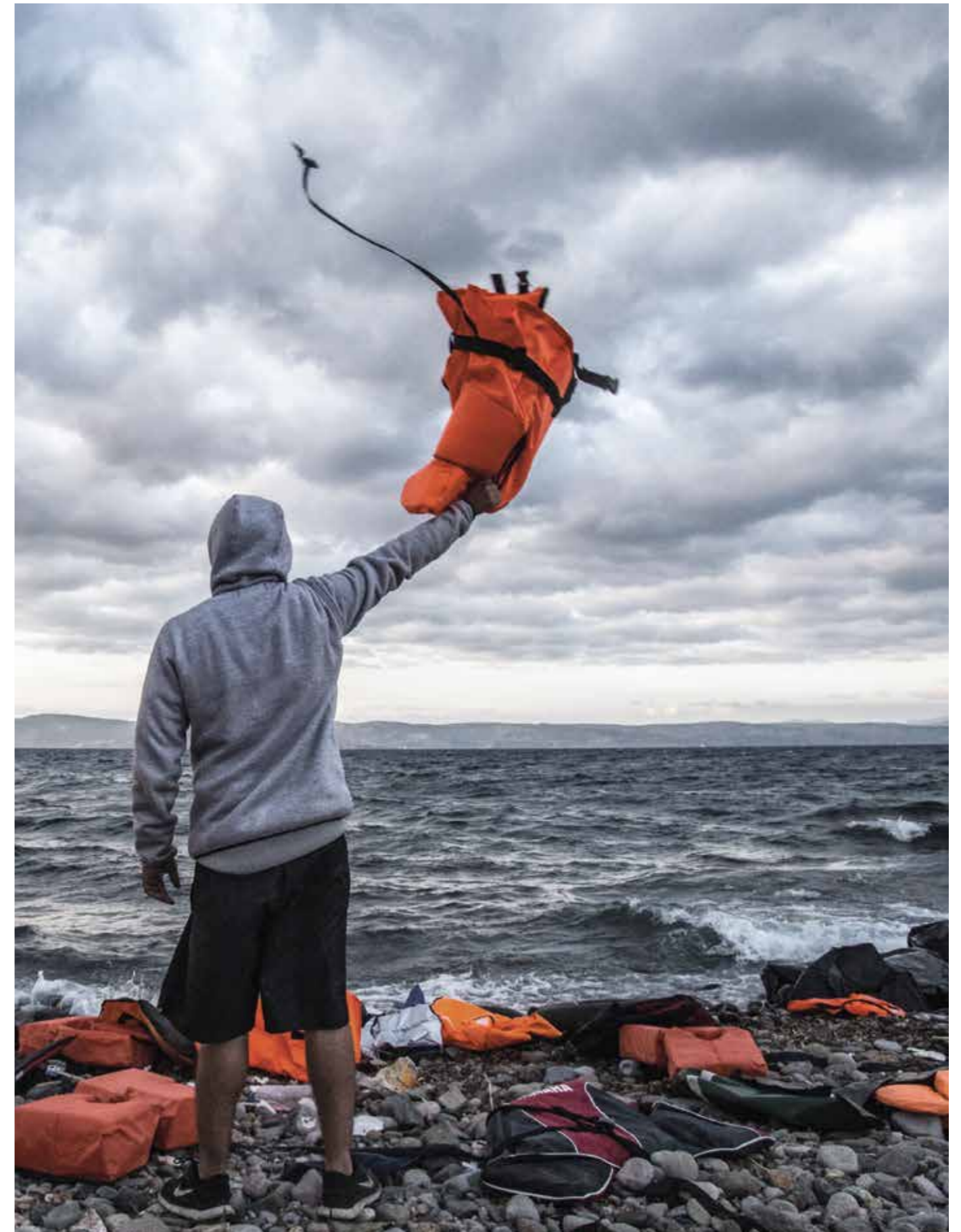
Irreguläre Migration – Herausforderung für ganz Europa.

Deutschland nimmt seine Verantwortung für die Bewältigung der humanitären Folgen von Flüchtlingsbewegungen wahr. Die Steuerung und Gestaltung dieser Herausforderung können allerdings nur eingebettet in eine funktionierende europäische Strategie und Praxis Wirkung entfalten.