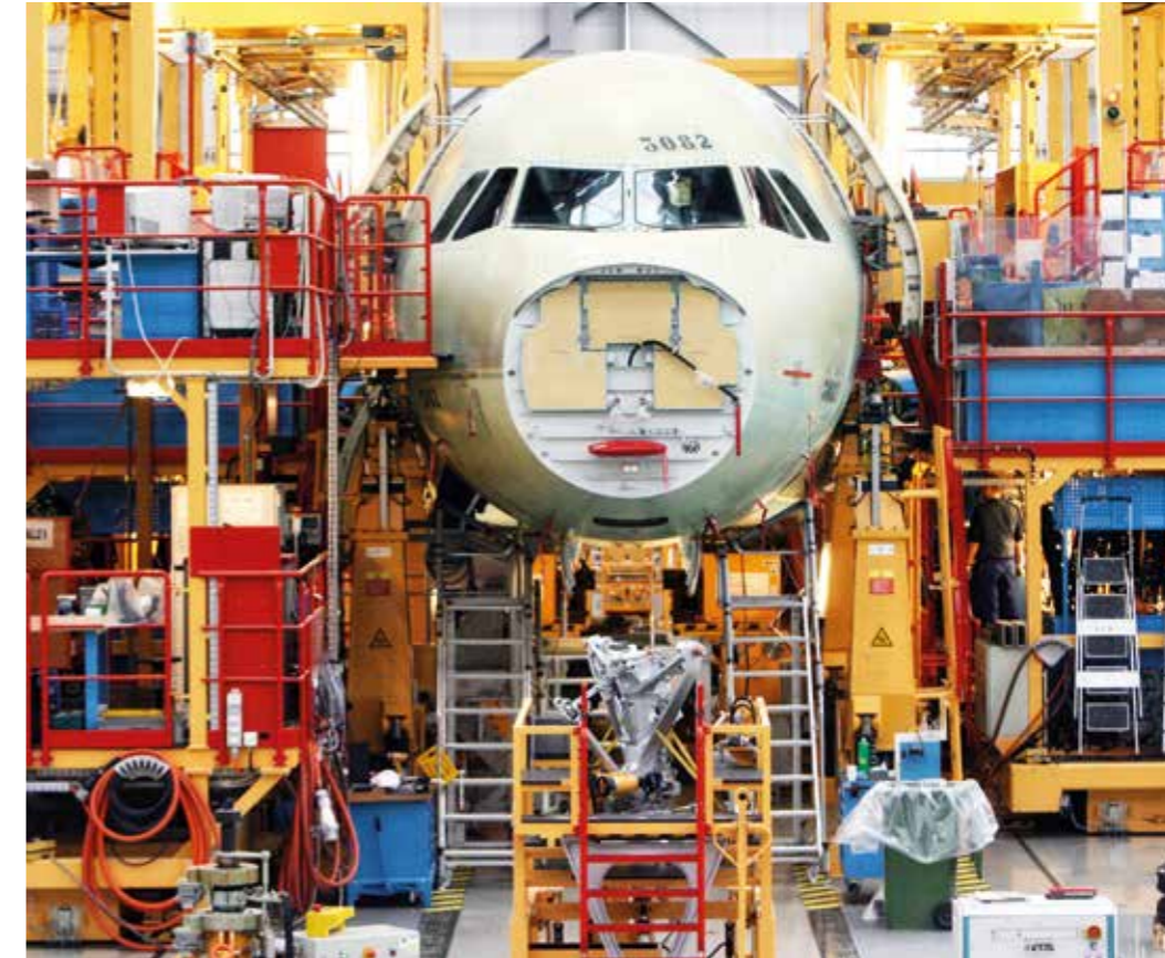
„Wirtschaftsstandort Deutschland“ – Montage einer Airbus-Passagiermaschine am Hightech-Standort Hamburg.

Zugleich basiert unsere Handlungsfähigkeit im internationalen – besonders europäischen und transatlantischen – Verbund auf einer klaren nationalen Positionsbestimmung.