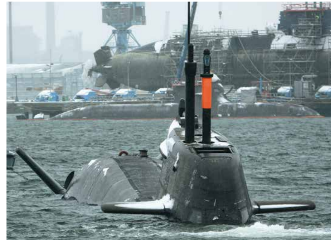
Nationale Schlüsseltechnologien – Grundlage technologischer Souveränität.

Gleichzeitig ist es notwendig, die eigene technologische Souveränität durch den Erhalt nationaler Schlüsseltechnologien zu bewahren und damit die militärischen Fähigkeiten und die Versorgungssicherheit sicherzustellen. Das Bundesministerium der Verteidigung wird hierzu seine besondere Fachexpertise in Entwicklung, Beschaffung, Ausbildung und Nutzung zur Verfügung stellen. Zu deren Erhalt bzw. ihrer Förderung verfügt die Bundesregierung über folgende Instrumente: ressortübergreifende Abstimmung und Priorisierung von Forschungs- und Technologiemaßnahmen, gezielte Industriepolitik, die Auftragsvergabe durch das Bundesministerium der Verteidigung sowie Exportunterstützung (im Rahmen der Einzelfallentscheidung auf der Grundlage der restriktiven Politischen Grundsätze der Bundesregierung von 2000). Die Exportunterstützung erfolgt insbesondere für EU-, NATO- und der NATO gleichgestellte Länder. Diese Flankierung kann auch auf sogenannte Drittstaaten ausgedehnt werden, wenn im Einzelfall für den Export von Kriegswaffen besondere außen- oder sicherheitspolitische Interessen sprechen oder für den Export sonstiger Rüstungsgüter im Rahmen des Außenwirtschaftsrecht zu schützende Belange des friedlichen Zusammenlebens der Völker oder der auswärtigen Beziehungen nicht gefährdet sind.