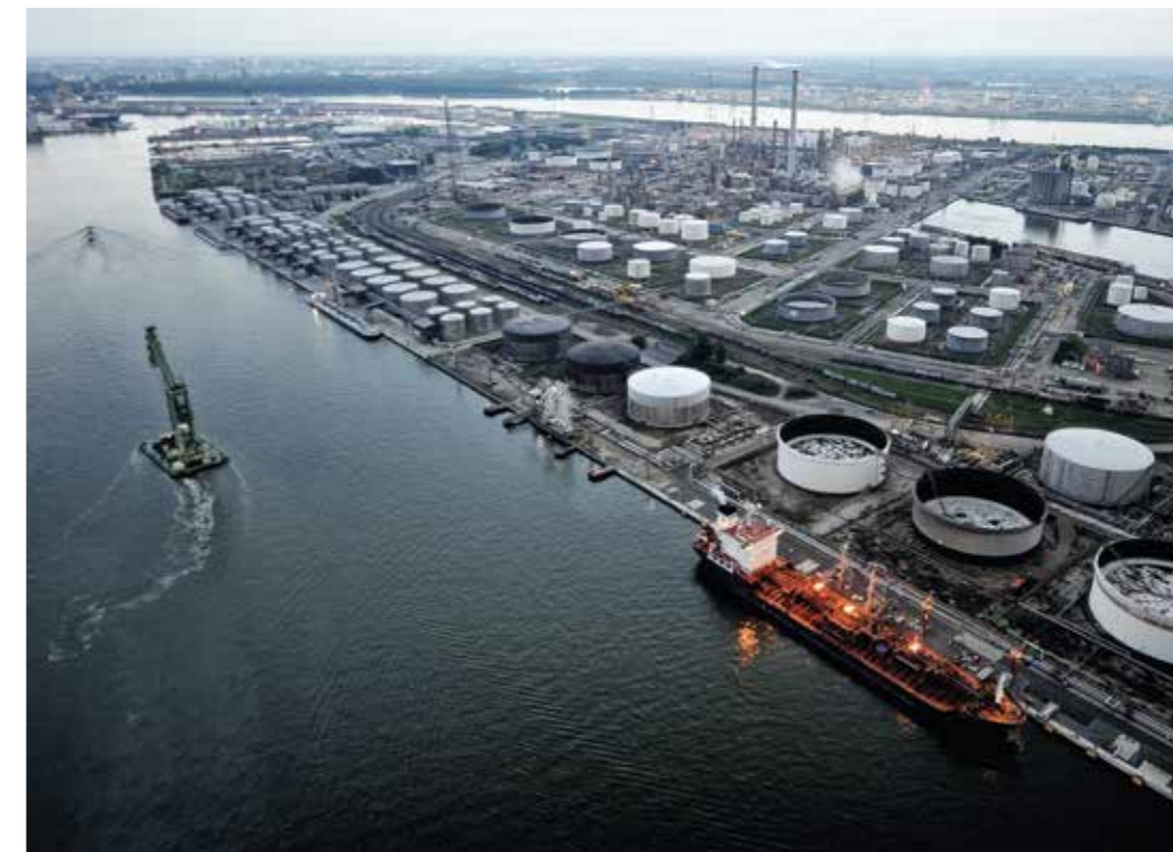
Tore zum weltweiten Handel – der ungehinderte Seetransport ist für die Exportnation Deutschland von großer Bedeutung.

Angesichts der Vielzahl potenzieller Ursachen und Angriffsziele muss Deutschland mit seinen Verbündeten und Partnern flexibel Elemente seines außen- und sicherheitspolitischen Instrumentariums einsetzen, um Störungen oder Blockaden vorzubeugen oder diese zu beseitigen.