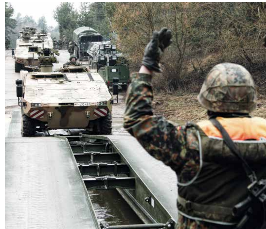
Landes- und Bündnisverteidigung – mit den Auslandseinsätzen gleichrangig im Aufgabenspektrum der Bundeswehr.

Diese Anforderungen machen es notwendig, die Bundeswehr zur Wirkung im gesamten Einsatzspektrum zu befähigen und einsatzbereit zu halten.