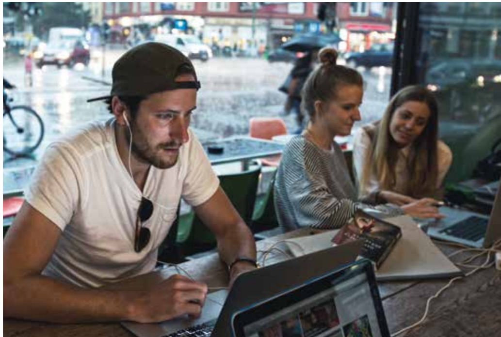
Grenzenlos, vernetzt, interaktiv und doch mit Risiken behaftet – Digitalisierung birgt Chancen und Risiken.

Gleichzeitig befördert die Globalisierung auch die Vernetzung und Verbreitung von Risiken und deren Folgewirkungen. Dies reicht von Epidemien über die Möglichkeit von Cyberangriffen und Informationsoperationen bis zum transnationalen Terrorismus.