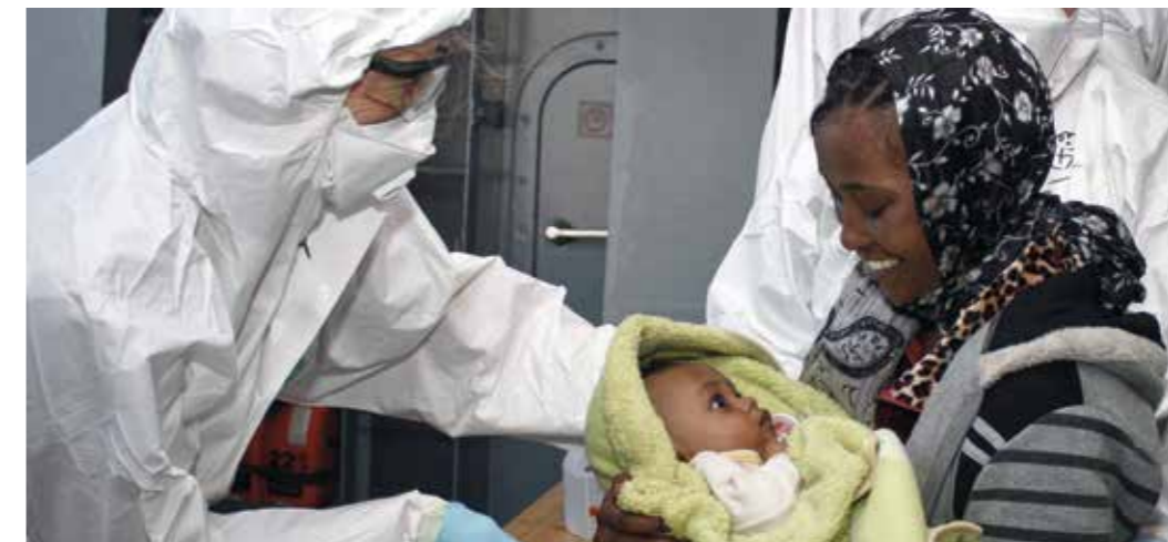
Gemeinsame Sicherheits- und Verteidigungspolitik – große Bandbreite ziviler und militärischer Fähigkeiten.

Die Asyl-, Flüchtlings- und Migrationspolitik und -praxis der EU ist von sicherheitspolitischer Relevanz und Wirkung, der effektive Schutz der europäischen Außengrenzen ist von zentraler Bedeutung. Darüber hinaus gilt es, in der Flüchtlings- und Migrationspolitik auf europäischer Ebene für eine faire Lastenteilung zu sorgen und zugleich im Dialog mit den Herkunfts-, Erstaufnahme- und Transitstaaten auch zukünftig tragfähige Lösungen zu erarbeiten.