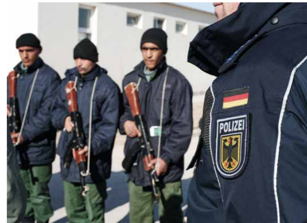
Aufbau staatlicher Strukturen – die Stärkung regionaler Eigenverantwortlichkeit ist Ausdruck unseres präventiven Ansatzes.

Auch in Zukunft wird es aber immer wieder Situationen geben, in denen erst ein robustes, völkerrechtlich legitimes militärisches Eingreifen der Diplomatie den Weg zu akzeptablen politischen Lösungen freimacht.