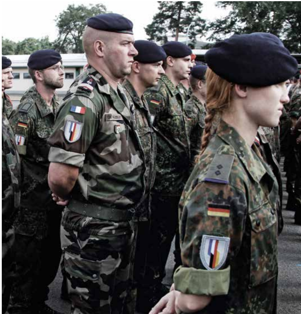
Multinationalität – gelebte Praxis auch für die Bundeswehr.

Multinationalität und Integration sind und bleiben Bestimmungsgrößen für die Bundeswehr. Für die Gestaltung der Verteidigungs- und Militärpolitik muss die Bundeswehr über ein umfangreiches bi- und multilaterales Instrumentarium verfügen, das kohärent anzuwenden und kontinuierlich auf seine Weiterentwicklung zu überprüfen ist. Multinationalität und Integration werden insbesondere auch in Strukturen, Einsätzen, langfristiger gemeinsamer multinationaler Fähigkeitsentwicklung und weiteren Kooperationsformen sowie in der Rüstungspolitik umgesetzt.