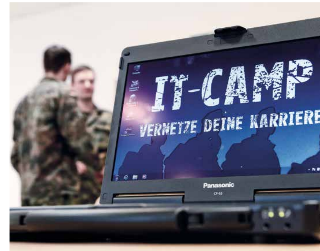
Moderne Anforderungen – Technologisierung und Digitalisierung erfordern hochqualifiziertes Personal.

Die Bundeswehr wird in Zukunft noch stärker von vielseitigem, aber auch spezialisiertem und hochqualifiziertem Personal abhängig sein. Langfristig sind weitere ungenutzte Potenziale zu mobilisieren – denn die wachsende Technologisierung und Digitalisierung werden Expertise erfordern, über die die Bundeswehr bisher nicht oder nicht ausreichend verfügt. Weitgehende personelle Autarkie wird nicht mehr das Organisationsprinzip für Personal sein. Vielmehr ist die Durchlässigkeit zwischen Bundeswehr und Wirtschaft zu erhöhen. Austauschmodelle zwischen Wirtschaft und Bundeswehr, die eine auf Zeit angelegte Kooperation mit externem Personal ermöglichen (Drehscheibe Bundeswehr-Wirtschaft), sind eine Möglichkeit, dieser Anforderung gerecht zu werden.