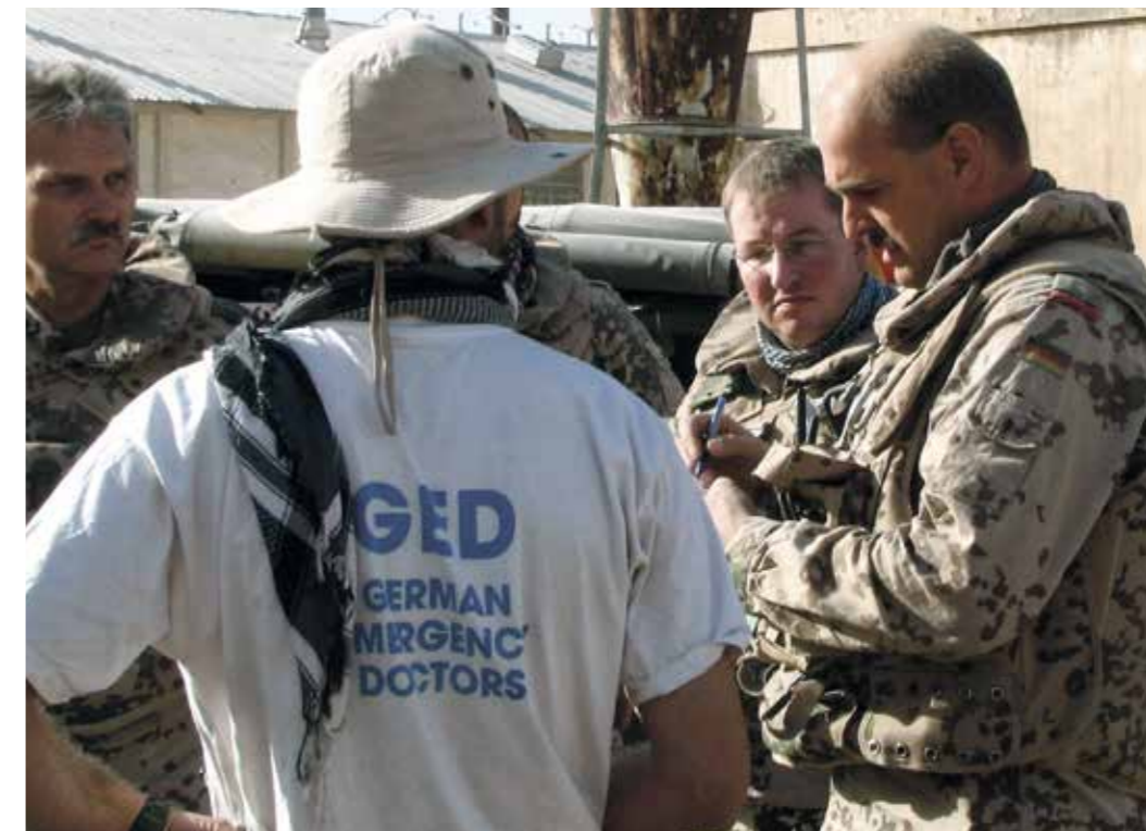
Zusammenarbeit von staatlichen und nichtstaatlichen Akteuren – auch für die Bundeswehr ein Schlüssel zur erfolgreichen Auftragsbefüllung.