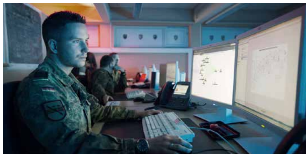
Effektives Informations- und Wissensmanagement – Ausgangspunkt moderner Führungsfähigkeit.

Die Bundeswehr strukturiert hierzu ihr Fähigkeitsprofil in die Bereiche Führung, Aufklärung, Wirkung und Unterstützung. Diese sind gleichwertig, bedingen einander und sind daher zu vernetzen. In diesem Wirkverbund ist eine agile, resiliente und robuste Aufstellung der Bundeswehr sicherzustellen.