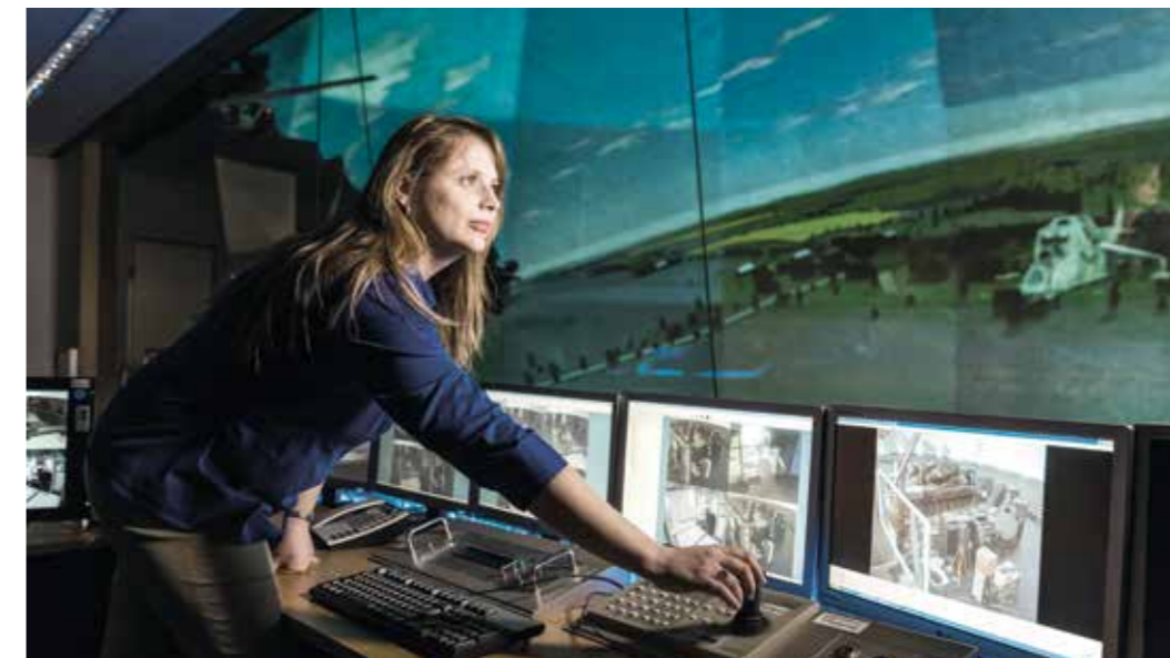
Großorganisation Bundeswehr – innovative Wege und Prozesse eines lernenden Systems.