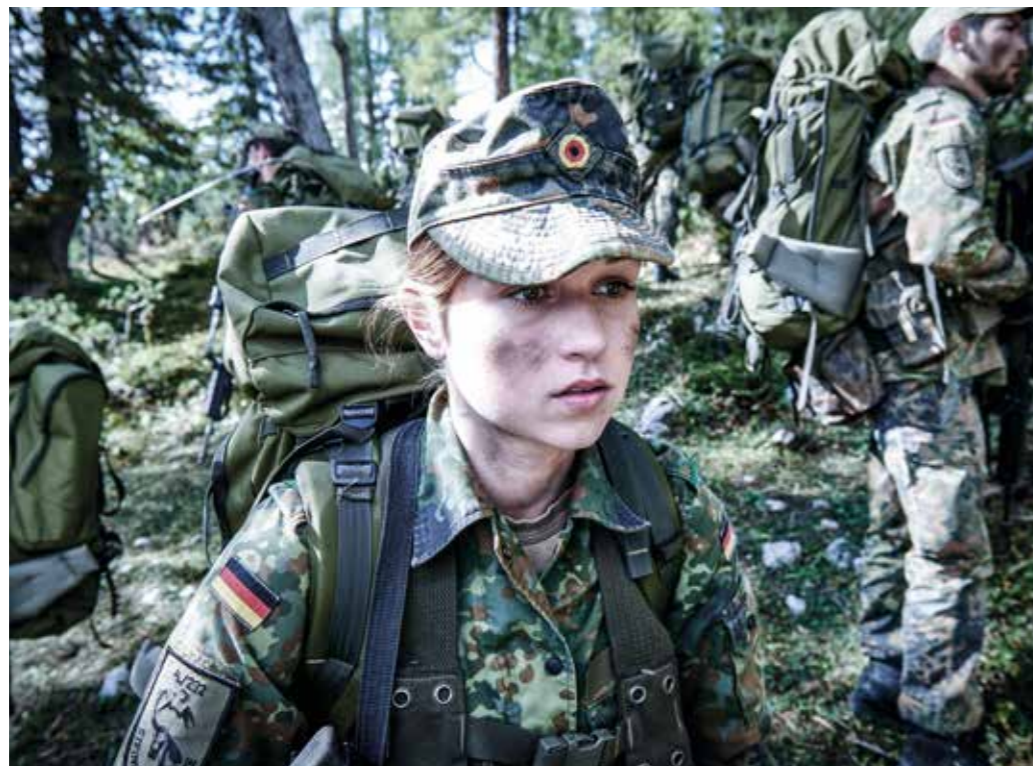
Der Mensch im Fokus – wichtigster Faktor für den Erfolg.

Die Menschen in der Bundeswehr sind der wichtigste Faktor für die Einsatzbereitschaft und Reaktionsfähigkeit der deutschen Streitkräfte. Die Großorganisation Bundeswehr braucht eine moderne, nachhaltige und demographiefeste Personalpolitik, die zukünftigen Herausforderungen konsequent und aktiv begegnet. Der demographische Wandel in Deutschland und die zunehmende Knappheit an Fachkräften werden die gesellschaftlichen und wirtschaftlichen Entwicklungen der nächsten Jahrzehnte maßgeblich prägen. Damit zusammenhängende Phänomene wie die Umkehr der Alterspyramide und die Ausdünnung der ländlichen Infrastruktur haben ebenso Auswirkungen auf das System Bundeswehr wie die fortschreitende Globalisierung, Digitalisierung und Individualisierung. Geänderte Lebenswünsche und -wirklichkeiten erfordern eine bessere Vereinbarkeit von Dienst und Familie. Der Arbeitgeber Bundeswehr muss mit all diesen Anforderungen flexibel und vorausschauend umgehen. Die Bundeswehr kann Auftragserfüllung und Einsatzbereitschaft nur sicherstellen, wenn sie über einen am tatsächlichen Bedarf orientierten Personalkörper verfügt. Dabei muss sich die Bundeswehr fortlaufend als ein wettbewerbsfähiger, flexibler und moderner Arbeitgeber positionieren. Seit dem Ende des Kalten Krieges wurde der Personalumfang der Bundeswehr kontinuierlich und deutlich reduziert. Zuletzt wurde die personelle Obergrenze 2010/2011 mit der Neuausrichtung der Bundeswehr auf einen Tiefstwert festgesetzt.