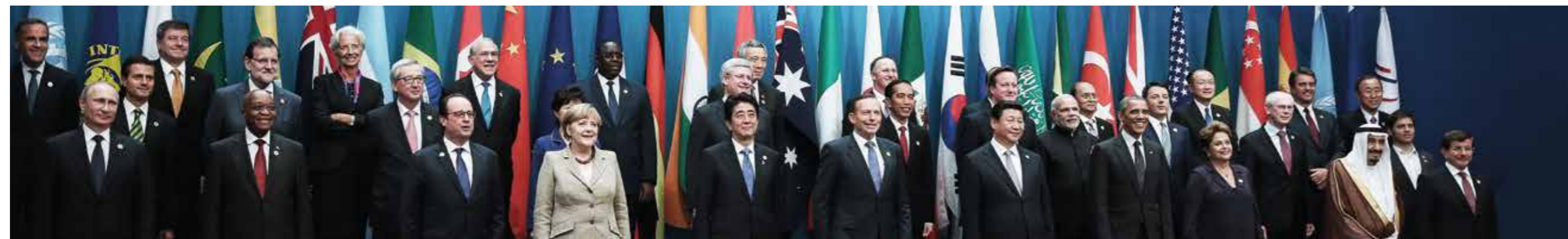
Dialog und Diskurs – unseren Herausforderungen kann nur gemeinsam begegnet werden.

Wir bauen darüber hinaus auf die vertrauensvolle Zusammenarbeit mit Staaten und Staatengruppen, die zur Lösung globaler oder regionaler Herausforderungen beitragen können. Gleiche Ziele und Interessen sind die Grundlage, um Risiken und Bedrohungen gemeinsam verantwortungsvoll zu begegnen.