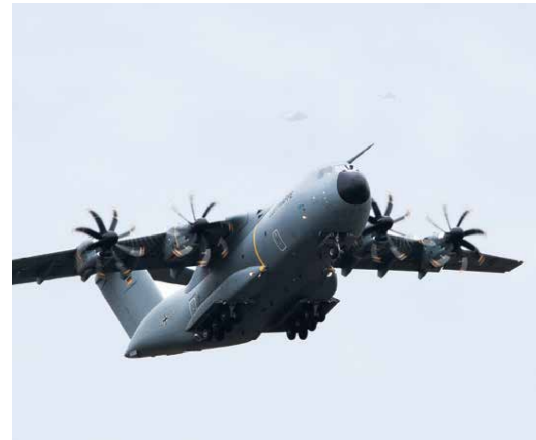
Fähigkeitsentwicklung in NATO und EU – Rahmen für die Ausrichtung der Bundeswehr.

Diesen Erfordernissen trägt das von Deutschland initiierte Rahmennationenkonzept Rechnung.