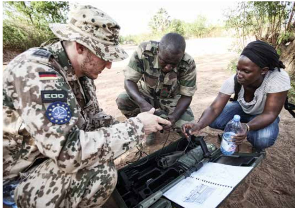
EU im gemeinsamen Einsatz – Zusammenhalt und vernetztes Handeln sind entscheidend.

Die Europäische Union mit 500 Millionen Bürgerinnen und Bürgern muss in einem sicherheitspolitisch volatilen Umfeld kohärent und wirkungsvoll auftreten. Angesichts vielfältiger Herausforderungen und begrenzter nationaler Möglichkeiten gilt es, europäische Ansätze zu stärken, die dafür notwendigen Strukturen effizient zu gestalten und bestehende Fähigkeitsdefizite zu beheben.