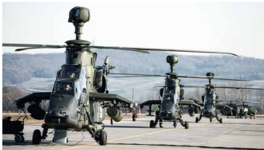
Modernisierung des Rüstungswesens – eine komplexe Herausforderung.