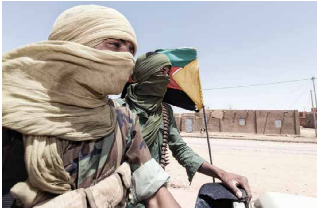
Fragile Staatlichkeit – Instabilität nah und fern beeinflusst auch Deutschland unmittelbar.

Schiiten sowie Auseinandersetzungen über das Verhältnis von Religion und Staat – bis hin zur fundamentalen Ablehnung und aktiven Bekämpfung des Staates – prägen die Lage. Das erhebliche Bevölkerungswachstum und die Erschöpfung natürlicher Ressourcen werden diese Zusammenhänge in Zukunft weiter verstärken.