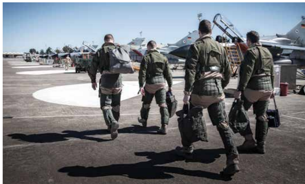
Verzugslos und konsequent – Auslandseinsätze tragen unmittelbar zu unserer Sicherheit bei.

In jüngster Zeit nimmt die Zahl der Einsätze und Missionen zu, die ein verzugsloses und konsequentes Handeln erfordern. Bei Maßnahmen gegen Proliferation von Massenvernichtungswaffen, Menschen- und Drogenhandel auf hoher See, aber auch bei kurzfristigen Unterstützungen von Partnern im Rahmen von Stabilisierungseinsätzen ist immer wieder eine schnelle Reaktion geboten. Dabei kommt es zunehmend zu Ad-hoc-Kooperationen von Staaten.