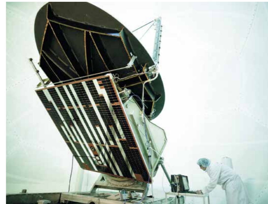
Überlegenheit durch Innovation – Anspruch unserer F&T-Aktivitäten.