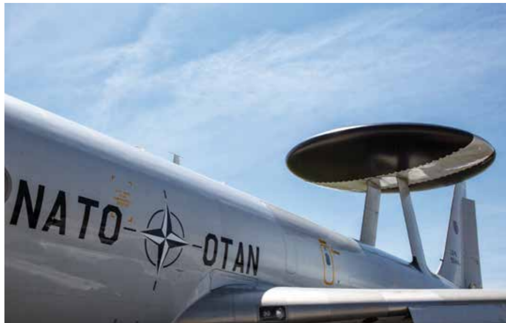
Verteidigungsbündnis und Wertegemeinschaft – täglich gemeinsam im Einsatz.

Ein weiteres wichtiges Element kooperativer Sicherheit stellt der aktive Beitrag der Allianz zu Rüstungskontrolle, Abrüstung und Nichtverbreitung dar.