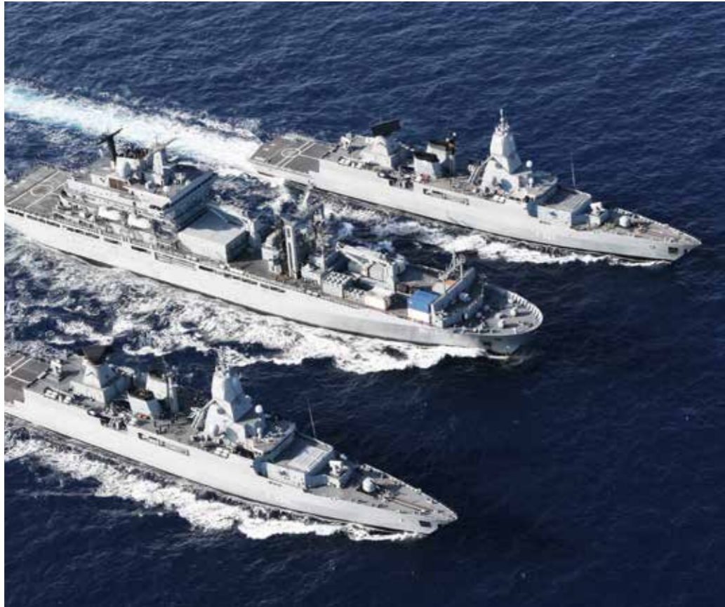
Außen- und sicherheitspolitische Verantwortung – die Sicherheit unserer Seewege ist von großer Bedeutung.