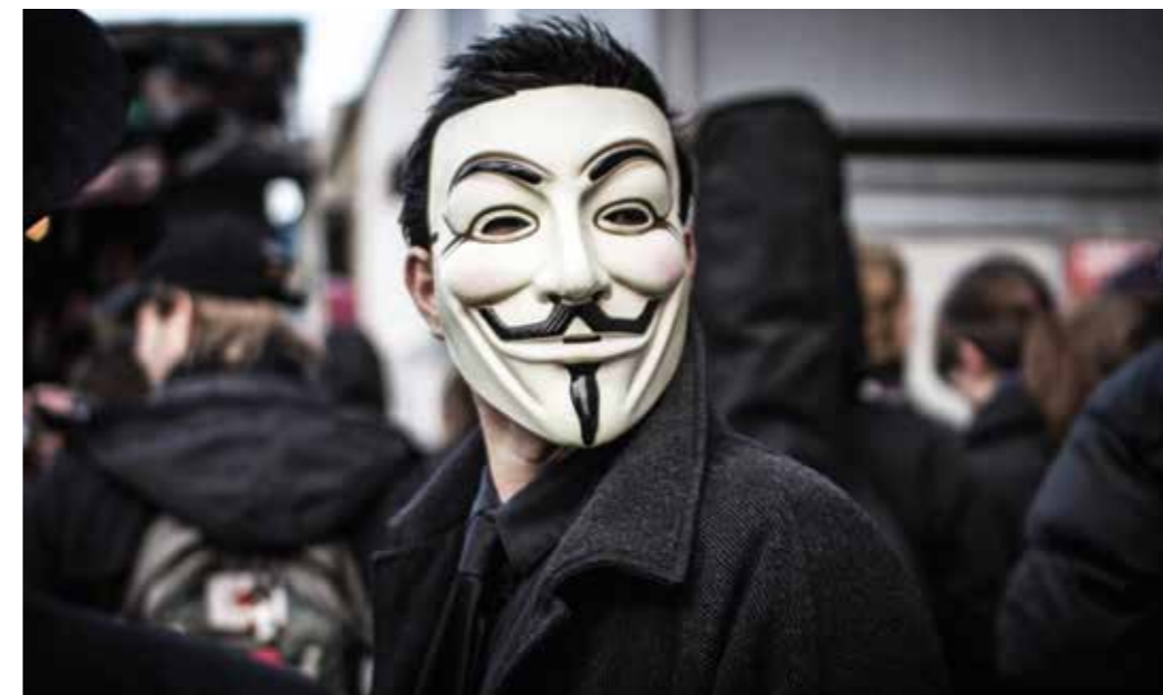
Identität unter Masken – Akteure in der Anonymität gewinnen zunehmend an Einflussmöglichkeiten.

Insgesamt hat sich der Cyber- und Informationsraum damit zu einem internationalen und strategischen Handlungsraum entwickelt, der so gut wie grenzenlos ist. Dieser wird künftig weiter an Bedeutung gewinnen.