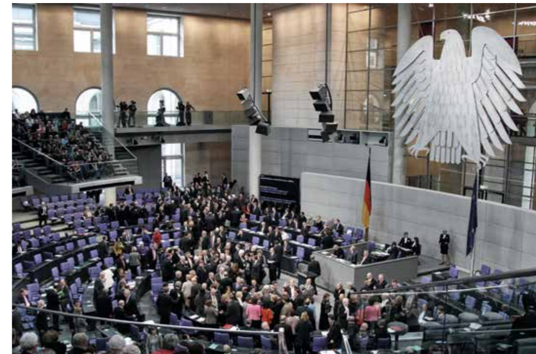
Entscheidungsverbund – unsere Soldatinnen und Soldaten können sich im Einsatz auf eine breite Zustimmung abstützen.

Für das NATO-Mitglied Deutschland, aber auch für eine weitere Integration in der EU sind Handlungs- und Gestaltungsfähigkeit in einem verlässlichen Rahmen in diesen Institutionen unerlässlich.