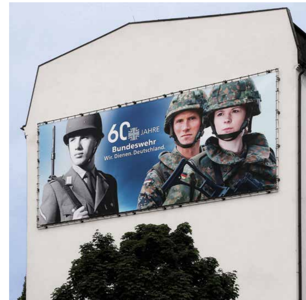
Mehr als 60 Jahre eigene Geschichte – starker Anker für die Tradition der Bundeswehr.

Dazu wird die Bundeswehr ihre über 60-jährige erfolgreiche eigene Geschichte noch stärker zu einem zentralen Bezugspunkt der Traditionsstiftung und -pflege machen. Es ist die Geschichte von Streitkräften in einer wehrhaften Demokratie, die sich im Kalten Krieg ebenso bewährt haben, wie sie nach 1990 die Wiedervereinigung unseres Landes vom ersten Tag an vorgelebt haben. Es ist auch die Geschichte einer Armee im Einsatz. Soldatinnen und Soldaten haben sich im Gefecht bewährt. Die Bundeswehr musste lernen, mit Tod und Verwundung umzugehen. Dafür stehen Orte des Gedenkens wie das Ehrenmal der Bundeswehr in Berlin und der Wald der Erinnerung in Potsdam.