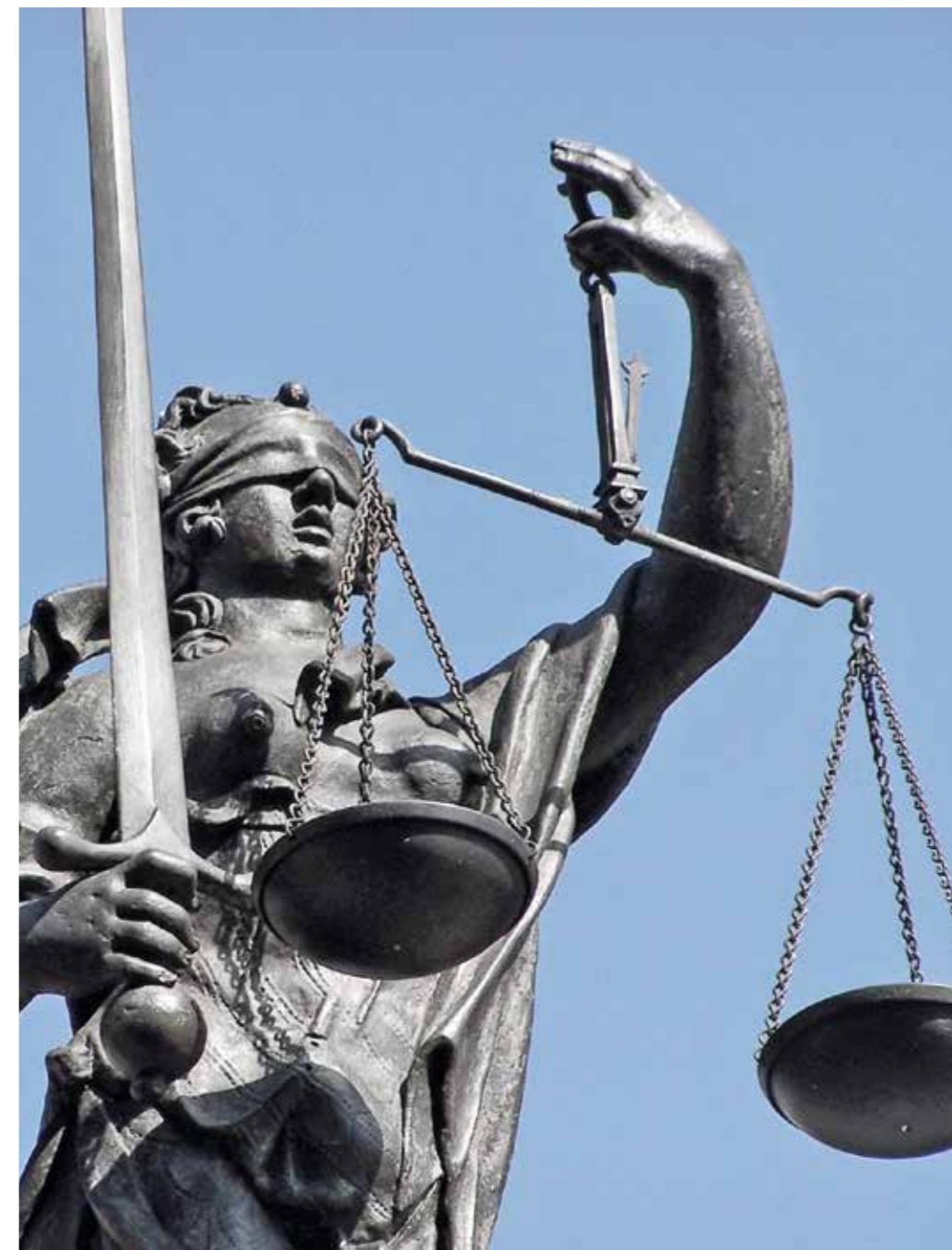
Stärke des Rechts – Deutschland setzt sich für die weltweite Durchsetzung des Völkerrechts ein.

Normen und Regeln entfalten jedoch nur dann ihre volle Wirkung, wenn Verstöße wirkungsvoll sanktioniert werden. In diesem Zusammenhang ist das Instrumentarium wirtschaftlicher und personenbezogener Sanktionen zu verfeinern und zielorientierter auszurichten. Darüber hinaus setzt sich Deutschland für die Stärkung der internationalen Strafverfolgung und Gerichtsbarkeit ein.