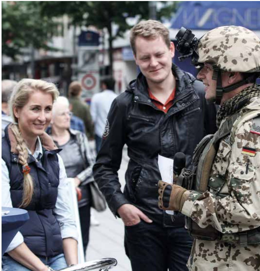
Erleb- und erfahrbar – der „Tag der Bundeswehr“.