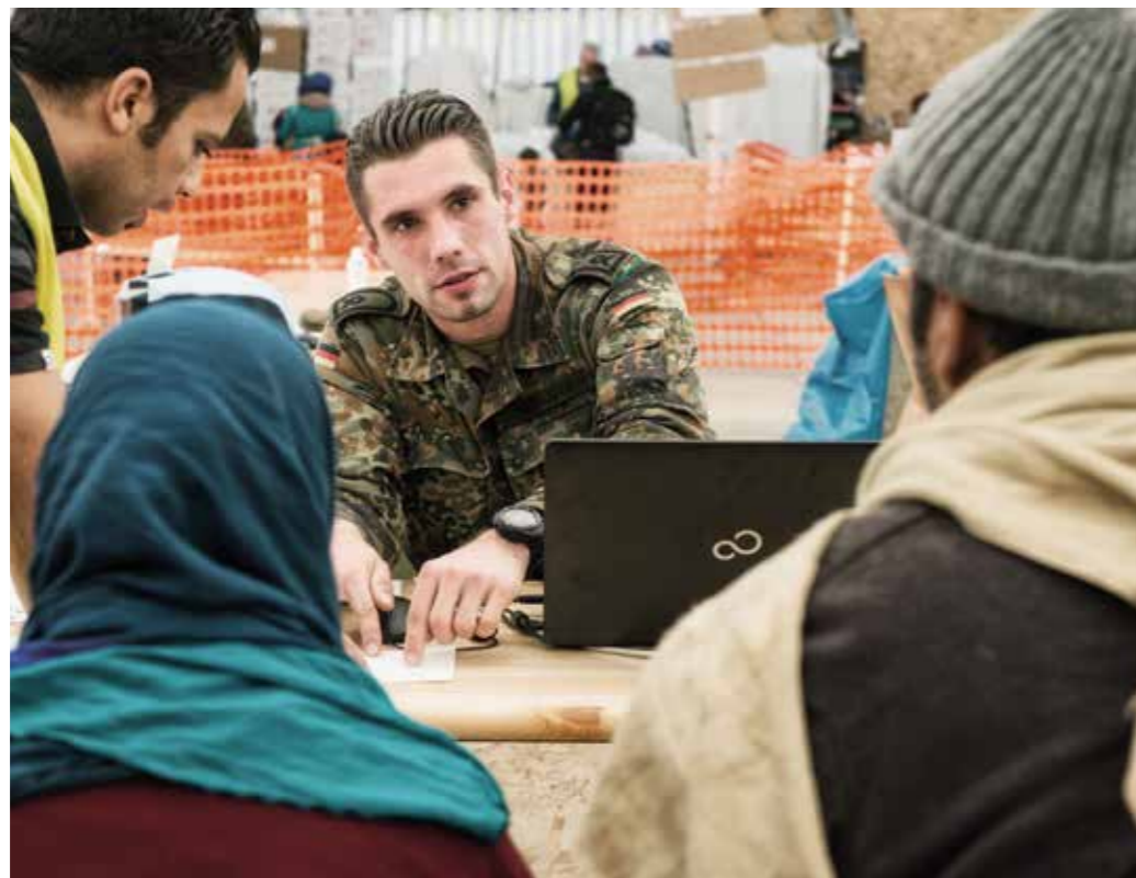
Gesamtstaatliche Sicherheitsvorsorge – die Bewältigung von Notlagen, Katastrophen und neuen Bedrohungen ist Aufgabe von uns allen.

Für die gesamtstaatliche Sicherheitsvorsorge ist die Stärkung von Resilienz und Robustheit unseres Landes gegenüber aktuellen und zukünftigen Gefährdungen von besonderer Bedeutung. Dabei gilt es, die Zusammenarbeit zwischen staatlichen Organen, Bürgerinnen und Bürgern sowie privaten Betreibern kritischer Infrastruktur, aber auch den Medien und Netzbetreibern zu intensivieren. Das Miteinander aller in der gemeinsamen Sicherheitsvorsorge muss selbstverständlich sein.