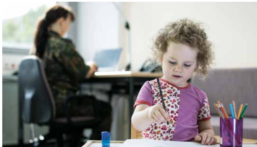
Aufeinander eingestellt – Dienst und Familie.

Um den Bedürfnissen der einzelnen Mitarbeiterinnen und Mitarbeiter besser gerecht zu werden, modernisiert die Bundeswehr darüber hinaus viele Instrumente des Personalmanagements. Der Balance von Privatleben und Dienst kommt eine zentrale Rolle zu. Die Frauen und Männer in der Bundeswehr sollen in allen Lebensphasen ihre Fähigkeiten und Begabungen voll entfalten können. Alle bereits unternommenen und künftigen Schritte sollen das Zusammenwachsen des Personalkörpers aus militärischen und zivilen Mitarbeiterinnen und Mitarbeitern und ein bundeswehrgemeinsames Selbstverständnis fördern. Weitere Anstrengungen zur Steigerung der Attraktivität des Dienstes in der Bundeswehr sind anzustreben. Die Steigerung der Attraktivität und der Erhalt der Wettbewerbsfähigkeit der Bundeswehr als Arbeitgeber bleiben eine strategische Daueraufgabe. Die Attraktivität des Arbeitgebers Bundeswehr wird dabei immer auch von der Einstellung und dem Grad der Zufriedenheit seiner Angehörigen geprägt.