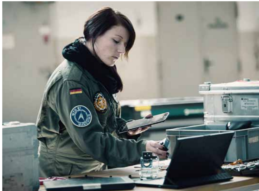
Rüstungsmanagement heute – Dienstleister für die Bundeswehr.

Neben dem Material wird die Bundeswehr in Zukunft noch stärker von vielseitigem und hochqualifiziertem (und damit spezialisiertem) Personal abhängig sein. Die Agenda Attraktivität hat dafür wichtige Grundlagen geschaffen. Langfristig sind weitere ungenutzte Potenziale zu mobilisieren – denn eine zunehmende Technologisierung und Digitalisierung wird Expertise benötigen, über die die Bundeswehr selber nicht verfügt. Weitgehende personelle Autarkie wird nicht mehr das Organisationsprinzip für Personal sein. Daher ist die Durchlässigkeit zwischen Bundeswehr und Wirtschaft zu erhöhen und sind zudem neue Wege der Kooperation zu gehen. Dabei sind die Grundsätze von Transparenz und Compliance handlungsleitend.