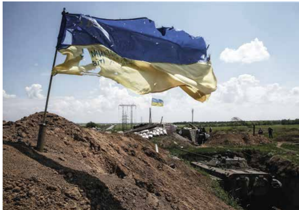
Zerrissenheit in der Nachbarschaft – die EU ist in vielfacher Hinsicht gefordert.

Wesentlich für den gemeinsamen Sicherheitsraum unseres Kontinents ist somit nicht die Konzeption einer neuen Sicherheitsarchitektur, sondern der Respekt und die konsequente Einhaltung der bestehenden und bewährten gemeinsamen Regeln und Prinzipien.