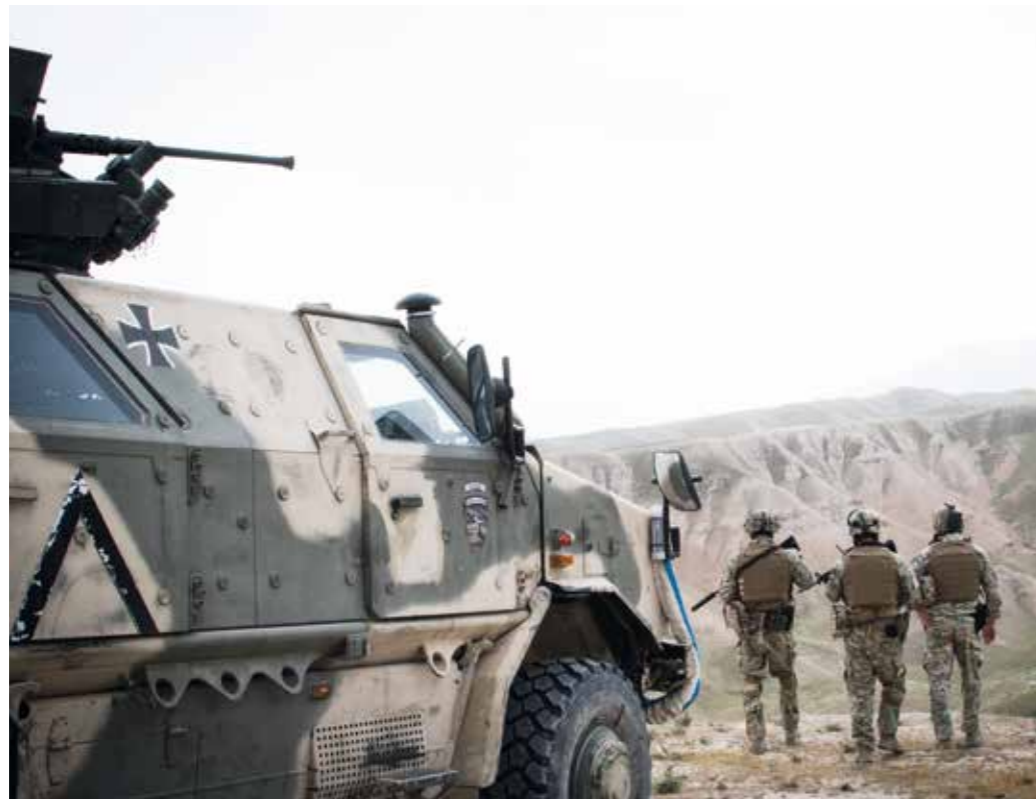
Auslandseinsätze – nicht nur deren Zahl, sondern auch deren Anforderungen an die Bundeswehr haben sich erhöht.

Die konventionelle Landes- und Bündnisverteidigung hat ihren Charakter im Vergleich zur Zeit des Kalten Krieges deutlich verändert: Sie muss sich heute vielfach bei kurzen Vorwarnzeiten gegen eine räumlich fokussierte Gefährdung durch militärische Kräfte unter- oder oberhalb der Schwelle offener Kriegführung stellen. Diese ist immer öfter in eine hybride Strategie eingebettet, die über die gesamte Bandbreite des Bedrohungsspektrums hinweg durch den orchestrierten Einsatz militärischer und nichtmilitärischer Mittel gekennzeichnet ist.