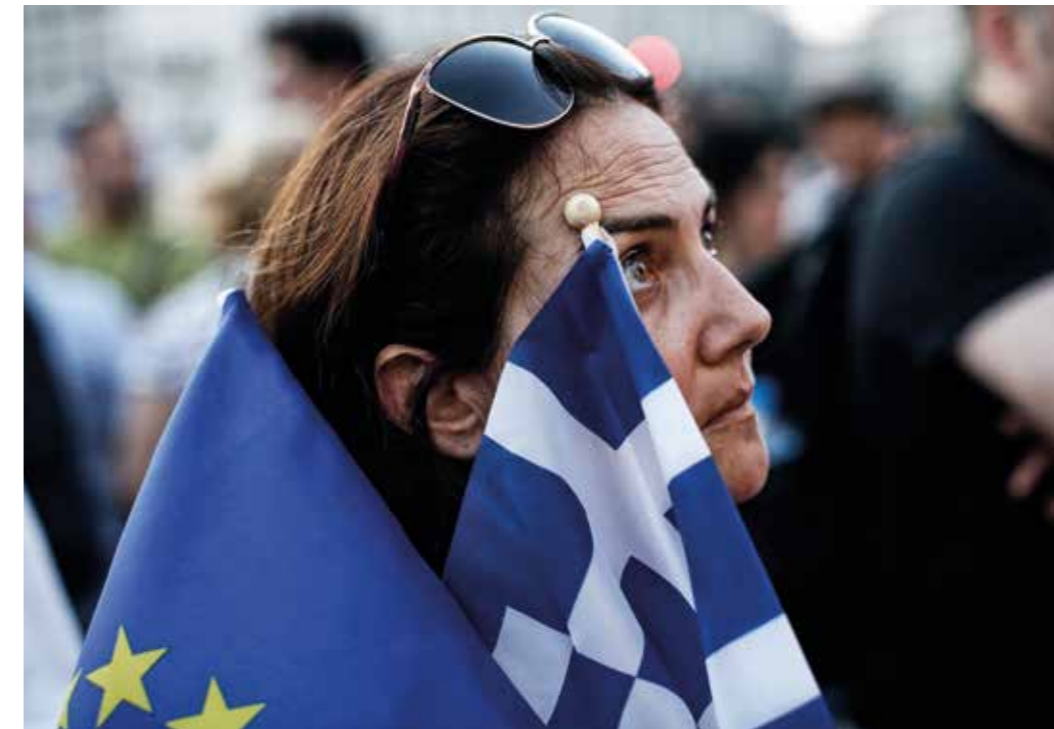
Entschlossen und gemeinsam – auch in Krisenzeiten.

Die EU wird bedeutende Anstrengungen unternehmen müssen, um ökonomisch und technologisch führend zu bleiben und Gesellschaften weltweit als Vorbild und Orientierung zu dienen. Nur wenn es gelingt, interne Bruchlinien zu überwinden, zentrifugalen Kräften erfolgreich entgegenzuwirken, den Modernisierungs- und Innovationspfad beharrlich weiter zu beschreiten und damit die innere Kohäsion und Einigkeit der EU zu stärken, wird sie auch in Zukunft stabilisierende Wirkung auf unsere Nachbarschaft entfalten. Insofern gilt es, sämtliche Möglichkeiten des Vertrags von Lissabon zu nutzen.