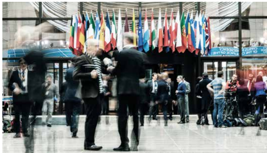
Einheit und Vielfalt – seit Jahrhunderten der Charakter Europas.

Die Perspektive, der EU eines Tages beitreten zu können, hat über viele Jahrzehnte eine stabilisierende Wirkung entfaltet. Es liegt im fundamentalen Interesse Deutschlands, diesen Sicherheitsgewinn zu konsolidieren und das Momentum der Erweiterung aufrechtzuerhalten. Voraussetzung dafür ist nicht zuletzt, dass die Europäische Union ihre Attraktivität bewahrt. Dies bedingt zugleich eine Festigung des Zusammenhalts der EU nach innen und die strikte Wahrung der Beitrittskriterien (Kopenhagener Kriterien). Es gilt, die Strahlkraft des europäischen Friedensprojekts als wesentliche Voraussetzung für weltweiten Einfluss und Ansehen zu erhalten.