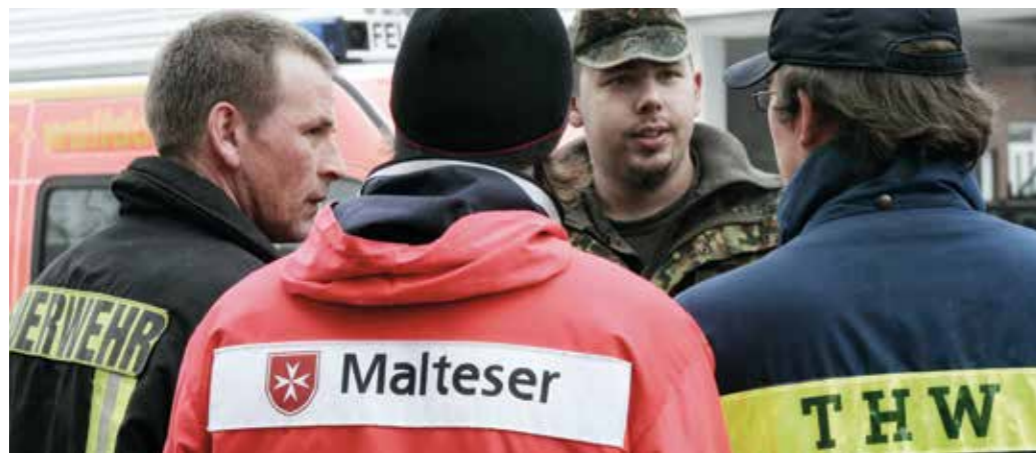
Gesamtstaatliches Handeln – die Bundeswehr als Teil des vernetzten Ansatzes.