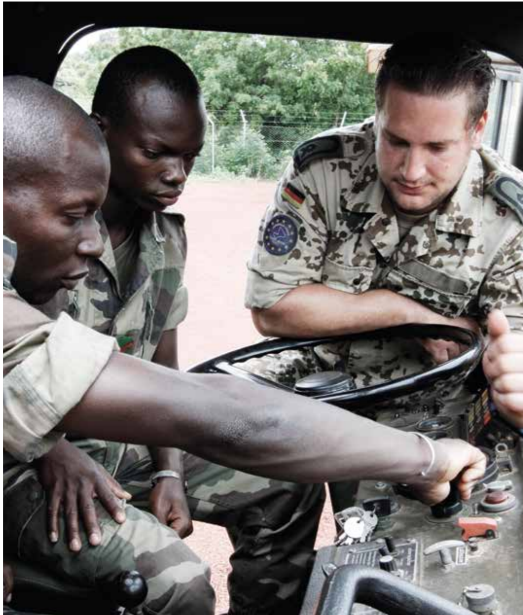
Ertüchtigung von Partnern – das heutige Aufgabenspektrum verändert das Verständnis von Wirkung.

Insbesondere bei Anwendung militärischer Gewalt sind Präzision und Skalierbarkeit wesentliche Voraussetzungen, um die beabsichtigte Wirkung zu erzielen und Schaden von Unbeteiligten abzuwenden. Abstandsfähigkeit erhöht die Erfolgswahrscheinlichkeit bei gleichzeitig gesteigerter Überlebens- und Durchhaltefähigkeit der eigenen Kräfte.