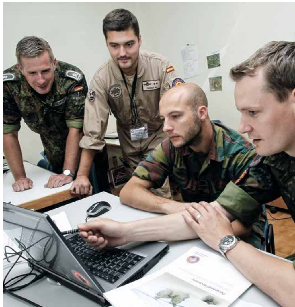
Gemeinsames Üben für gemeinsames Handeln – Multinationalität ist heute gelebte Praxis in allen europäischen Streitkräften.