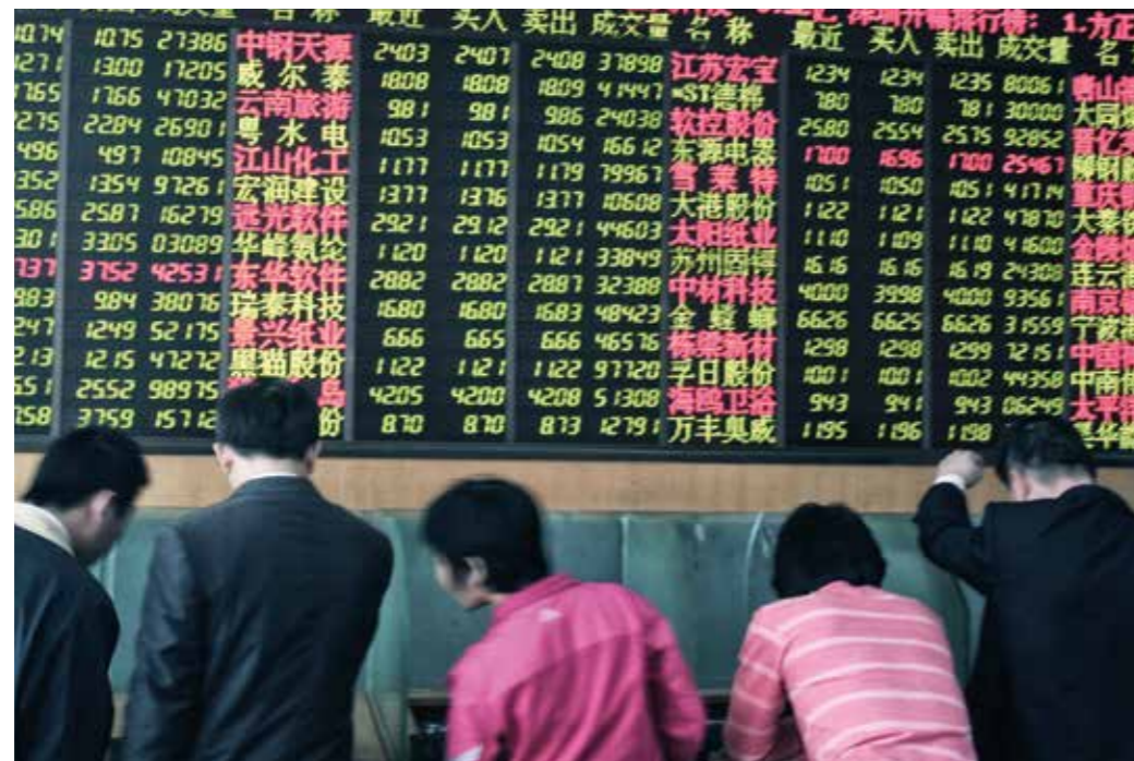
Dynamisches Wachstum – Macht verschiebt sich rasant zwischen Orten und Akteuren.

Damit gewinnen Organisationen und Foren an Bedeutung, die sich maßgeblich aus Mitgliedern dieser Staatengruppe zusammensetzen. Die BRICS-Gruppe ist ebenso ein Beispiel wie die Verbindung der ASEAN-Länder oder der Kompetenzzuwachs lateinamerikanischer und afrikanischer regionaler und sub-regionaler Organisationen. Auch der Bedeutungszuwachs der G20, die sich zu einem wichtigen Forum für die internationale Zusammenarbeit in Weltwirtschafts- und Finanzfragen etabliert haben, ist maßgeblich dem Aufstreben von Schlüsselstaaten geschuldet.