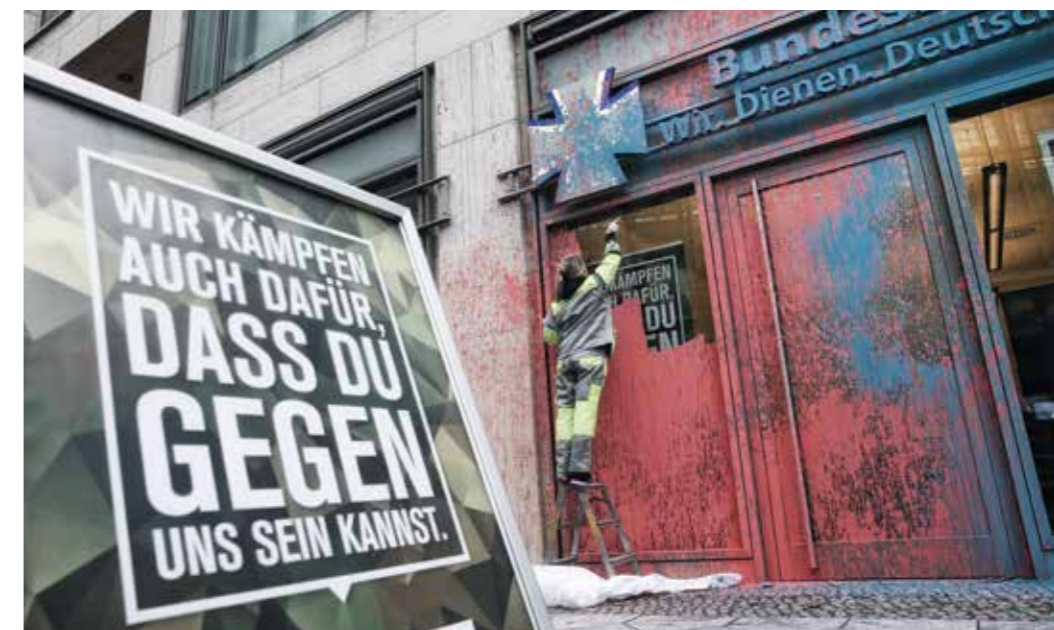
Kontroversen machen das Bild bunt – die Bundeswehr stellt sich der Debatte.

Auch daraus ziehen insbesondere die Soldatinnen und Soldaten den Rückhalt für ihren Auftrag – und fühlen sich getragen von denjenigen Menschen, deren „Recht und Freiheit tapfer zu verteidigen“ sie geschworen haben, im äußersten Fall sogar unter Einsatz ihres Lebens. In diesem Verständnis fördert die Bundeswehr auch den sicherheitspolitischen Diskurs in unserem Land, etwa durch ihre Jugendoffiziere. Denn es braucht einen steten Austausch über die Bundeswehr und ihre Aufgaben: so umfassend und so ernsthaft wie möglich – und so kontrovers wie nötig.