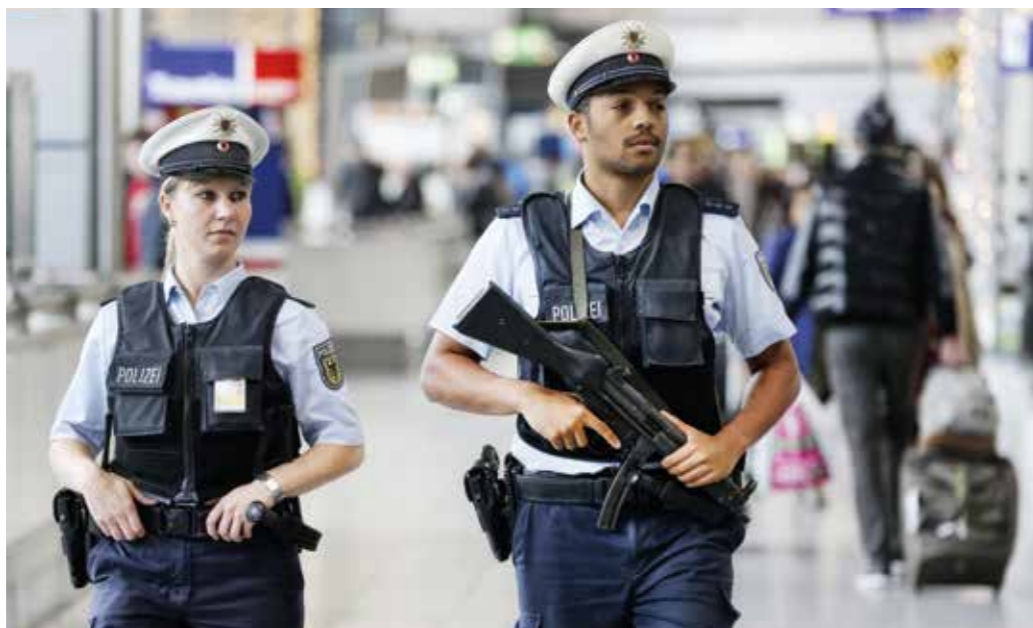
Gesamtstaatliche Sicherheit hat viele Gesichter – unsere Sicherheitsvorsorge beginnt in Deutschland.

Unser Engagement für Sicherheit und Stabilität des internationalen Umfelds trägt immer auch zur gesamtstaatlichen Sicherheitsvorsorge unseres Landes bei. Beides erfordert Strategiefähigkeit und Zukunftsorientierung sowie gleichzeitig eine nachhaltige Ressourcenausstattung und Vernetzung unseres sicherheitspolitischen Instrumentariums.