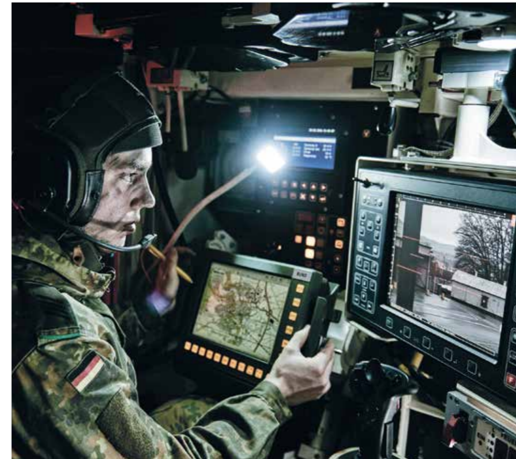
Vom Austausch von Wissen und Erfahrung gemeinsam profitieren – die Rolle der Reserve verändert sich.