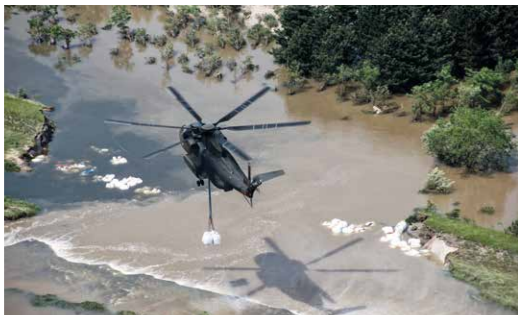
Verlässlicher Partner – auch im Inland.

Davon unabhängig kann die Bundesregierung die Streitkräfte nach Artikel 87a Absatz 3 des Grundgesetzes im Verteidigungs- und Spannungsfall für Aufgaben des Objektschutzes und der Verkehrsregelung einsetzen. Ferner können nach Artikel 87a Absatz 4 des Grundgesetzes die Streitkräfte auch im Fall des inneren Notstandes, das heißt bei einer drohenden Gefahr für den Bestand oder die freiheitlich demokratische Grundordnung des Bundes oder eines Landes, im Sinne des Artikels 91 Absatz 2 des Grundgesetzes eingesetzt werden. Die engen Voraussetzungen, an die der Einsatz der Streitkräfte beim inneren Notstand geknüpft ist, lassen in diesen Fällen einen Rückgriff auf die Grundlage der Artikel 35 Absatz 2 oder 3 des Grundgesetzes nicht zu.