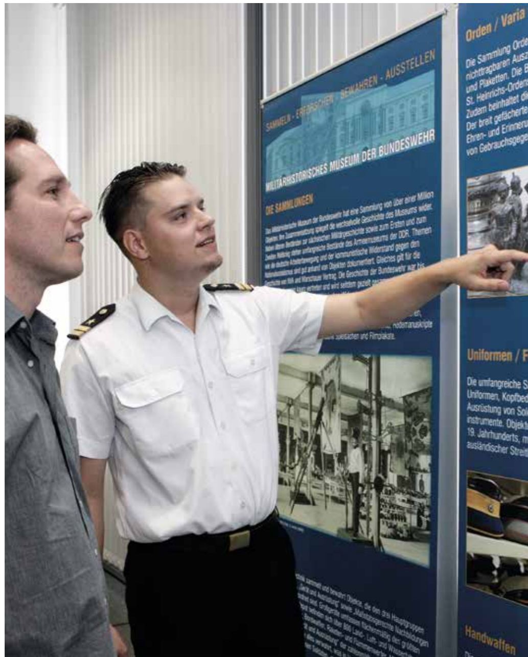
Traditionspflege in der Bundeswehr – sie setzt auf eine offene Diskussionskultur und persönliches Engagement.

Die Traditionspflege der Bundeswehr vollzieht sich zwischen den Generationen über die Weitergabe von Werten, Symbolen und handlungsleitenden Beispielen – gerade auch in unserer jüngeren Geschichte. Sie setzt auf eine offene Diskussionskultur und auf persönliches Engagement.