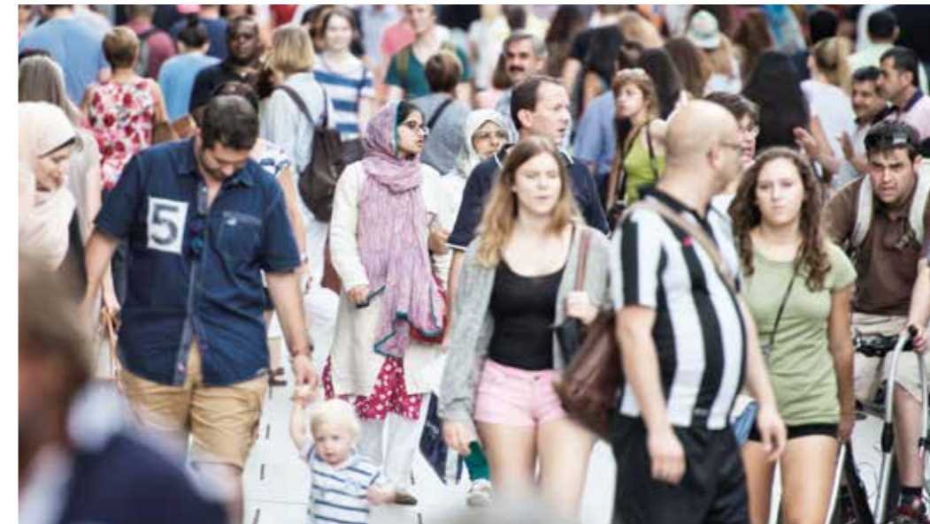
Eine Gesellschaft im Umbruch – auch Deutschland muss sich den Herausforderungen der Urbanisierung und des demographischen Wandels stellen.

In vielen Teilen der Welt steht der Staat als zentrales Ordnungselement in seiner Legitimation und Funktionalität noch anderen Herausforderungen gegenüber: Schlechte Regierungsführung, informelle Ökonomien, die durch weit verbreitete Vetternwirtschaft und Korruption gekennzeichnet und vielfach mit organisierter Kriminalität verflochten sind, befördern innerstaatliche Konflikte sowie regionale und internationale Krisen.