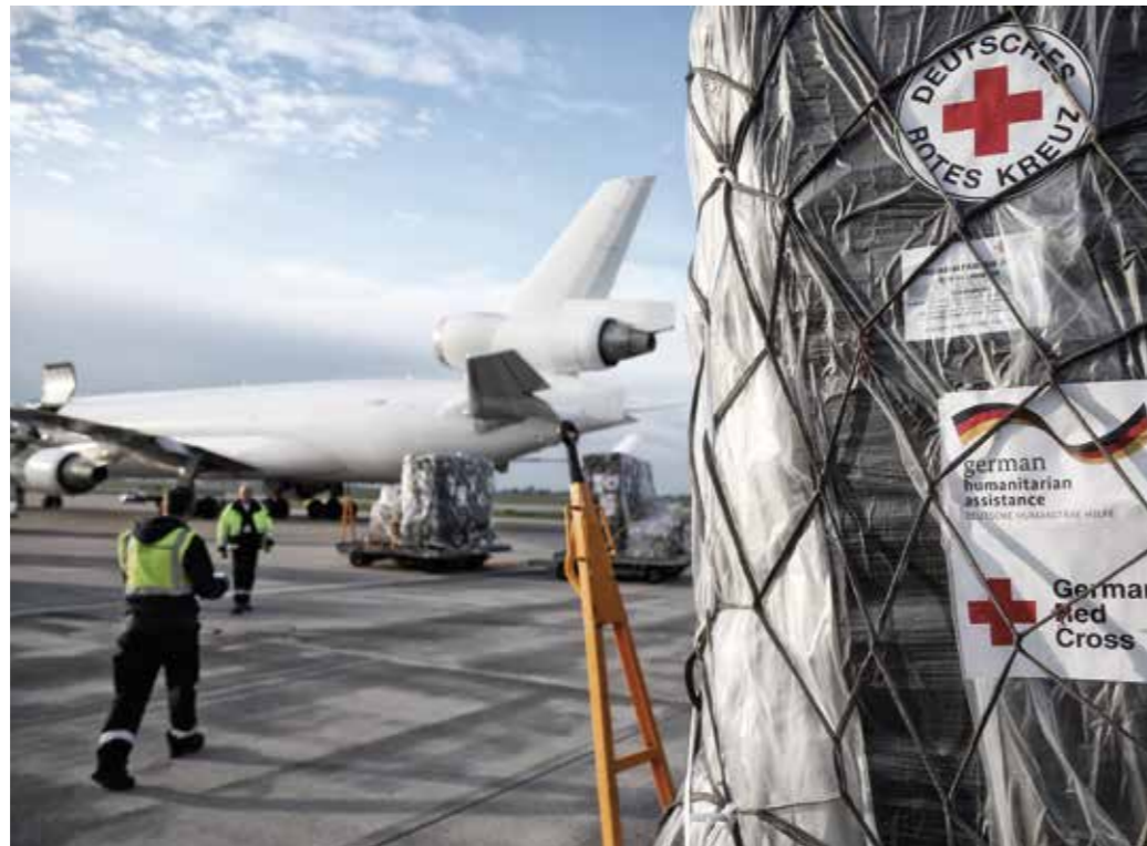
Gemeinsam noch stärker – staatliche und zivile Akteure arbeiten schon lange Hand in Hand, nicht nur bei Hilfslieferungen in Krisen- und Konfliktgebieten.