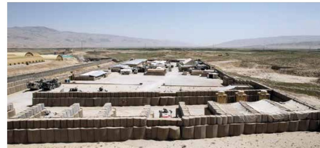
Flexibilität und Adaptionfähigkeit – Anforderungen an unsere Organisation, nicht nur im Einsatz.

Art, Umfang und Intensität der Aufgabenwahrnehmung durch die Bundeswehr haben sich jedoch aufgrund des dynamischen und komplexen sicherheitspolitischen Umfelds verändert und werden auch weiterhin einem steten Wandel unterliegen. Daher sind Aufgaben, verfügbare personelle und materielle Ressourcen sowie Strukturen fortwährend aufeinander abzustimmen.