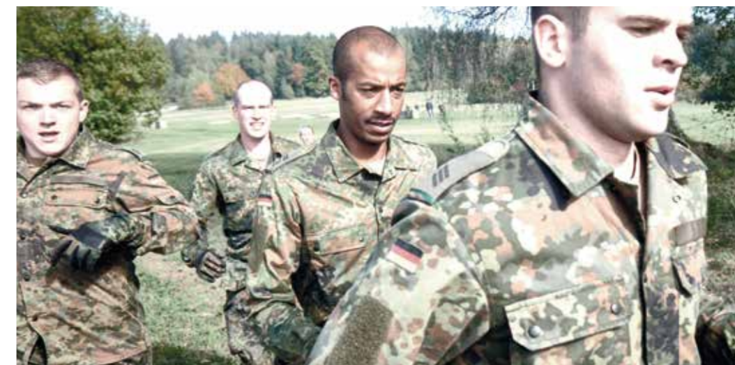
Vielfalt und Chancengerechtigkeit – Potenziale fördern und fordern.

Ziel ist ein modernes Diversity Management in der Bundeswehr, das vorhandene Potenziale besser nutzt und weitere strategisch erschließt. Im Blickfeld stehen Bereiche wie Alter, Behinderung, ethnische oder kulturelle Herkunft, Geschlecht, Religion oder sexuelle Orientierung. Diversity Management beginnt als Führungsaufgabe. Dies unterstreicht den querschnittlichen und strategischen Charakter dieser Aufgabe für die gesamte Bundeswehr.