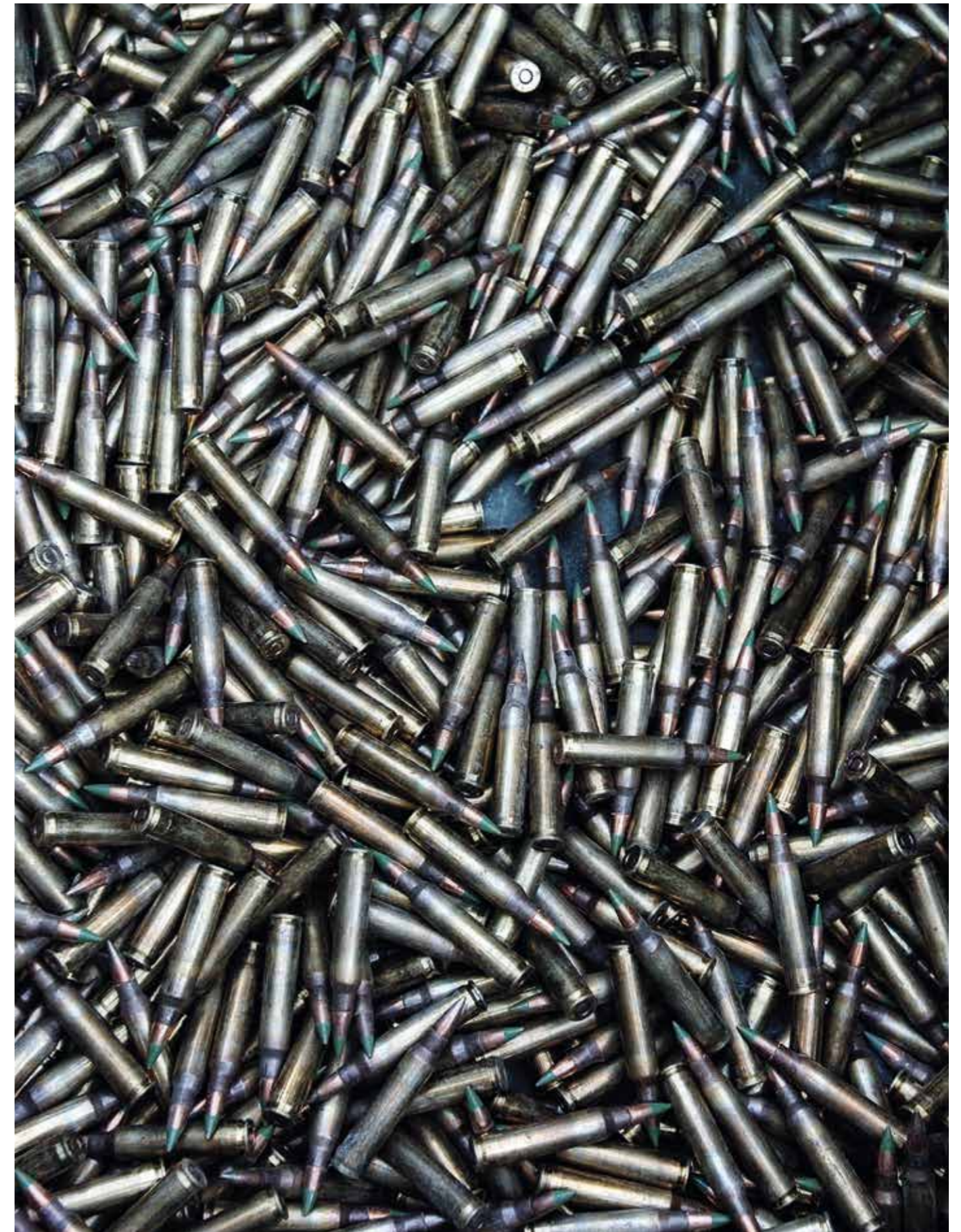
Rüstungskontrolle und verantwortungsvolle Abrüstung – Elemente vorausschauender und nachhaltiger Sicherheitspolitik.