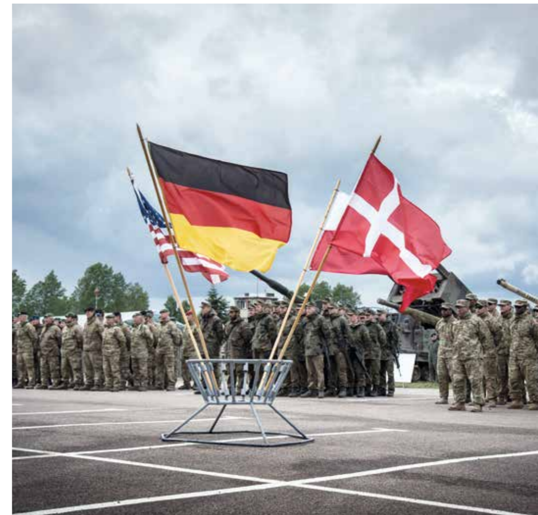
Atlantische Partner – für Sicherheit gemeinsam eintreten.

Deutschland hat das Rahmennationenkonzept in die NATO eingebracht. Europäische Mitgliedstaaten verpflichten sich dabei in einem strukturierten und verbindlichen Ansatz, ihre Fähigkeiten in multinationale Fähigkeitscluster zu stellen sowie sich auch zu größeren Verbänden zu strukturieren. Die Bundesregierung setzt sich damit für eine stärkere Relevanz und Sichtbarkeit des europäischen Fähigkeitsdispositivs in der Allianz ein.