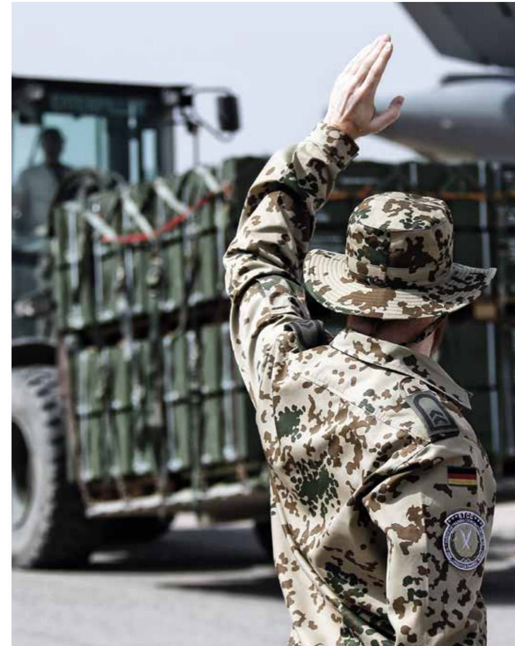
Unterstützung – unverzichtbar für die Auftragserfüllung.

Unterstützung ist eine elementare Voraussetzung für die Befähigung zur Führung, Aufklärung und Wirkung. Sie muss – auch unter Rückgriff auf Beiträge aus der Wirtschaft – die Auftragserfüllung aller militärischen und zivilen Organisationsbereiche ermöglichen. Logistik, Gesundheitsversorgung und der gesamte Betrieb im Inland sind bedingende Voraussetzungen zur Auftragserfüllung. Im veränderten Aufgabenspektrum der Bundeswehr kommt es besonders darauf an, die Voraussetzungen von Projektions- und Verlegefähigkeit sowie für die Anlehnung von Partnern zu schaffen. Mit Blick auf die Rolle Deutschlands als Rahmennation sowie als Lead- und Host-Nation sind die Unterstützungsleistungen national weiterzuentwickeln und multinational abzustimmen.