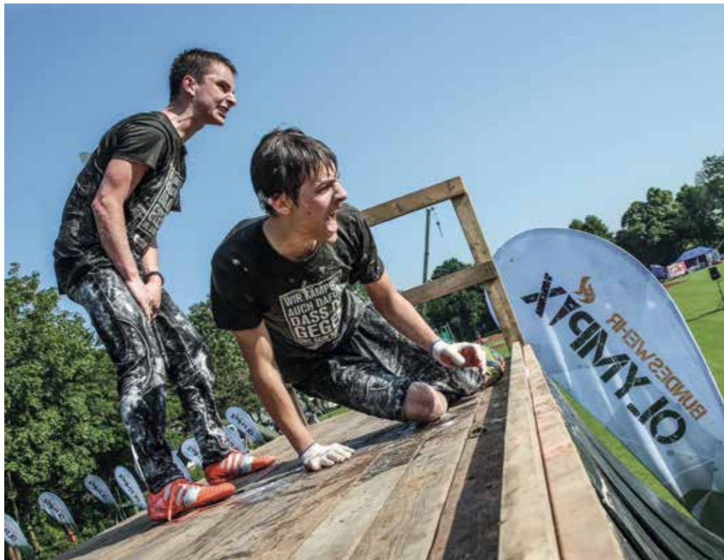
Gute Argumente als Arbeitgeber – frühzeitige Angebote für vielseitige Karrierepfade.

Die Bundeswehr bietet heute ein breites Angebot an Karrieremöglichkeiten. Auch wenn der quantitative Bedarf wenige Jahre nach Aussetzen der Wehrpflicht noch gut gedeckt werden kann, muss sich die Bundeswehr weitere Potenziale auf dem Arbeitsmarkt erschließen. Ähnlich der Wirtschaft fehlen auch der Bundeswehr Spezialisten, etwa IT-Fachleute, Ingenieure und Sanitätspersonal. Sie müssen gezielt angesprochen werden. Ebenso muss der Anteil von Frauen und von Menschen mit Migrationshintergrund in der Bundeswehr weiter steigen. Sie spielen eine wichtige Rolle bei dem Bild, das die Bundeswehr von sich nach außen transportiert.