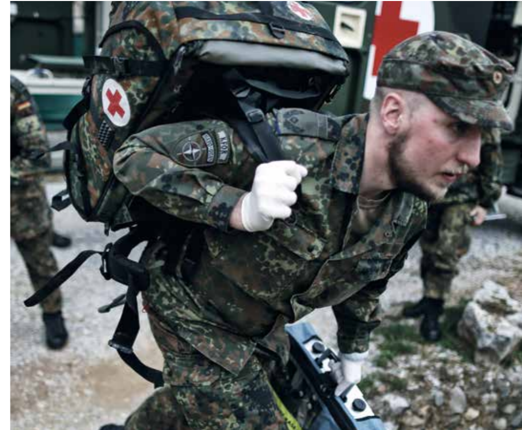
Umfassende Unterstützung – fester Bestandteil jedes Einsatzes.