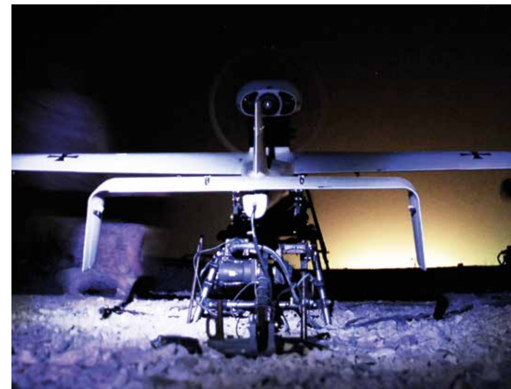
Klares Lagebild – essenziell für unsere Analyse und für militärische Entscheidungen.

Global ausgerichtete und multinational kompatible Aufklärung ist Voraussetzung für die effektive Informationsbedarfsdeckung und damit für die Analyse-, Beurteilungs- und Führungsfähigkeit auf strategischer, operativer und taktischer Ebene. Damit ist für die Bundesregierung ein unverzichtbarer und kontinuierlicher Beitrag zum ressortübergreifenden Lagebild für die Entwicklung ihrer Handlungsoptionen verbunden. Aufklärung muss das gesamte Spektrum der nationalen und internationalen Krisenvorsorge und des Krisenmanagements umfassen. Hierbei kommt der Krisenfrüherkennung besondere Bedeutung zu. Der Aufbau von Regionalexpertise ist deshalb zu fördern und zu verstetigen.